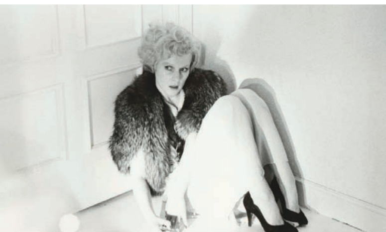
LE SECRET DE VERONIKA VOSS (1982) de Rainer Werner Fassbinder