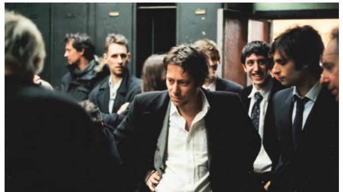
LA QUESTION HUMAINE (2007) de Nicolas Klotz