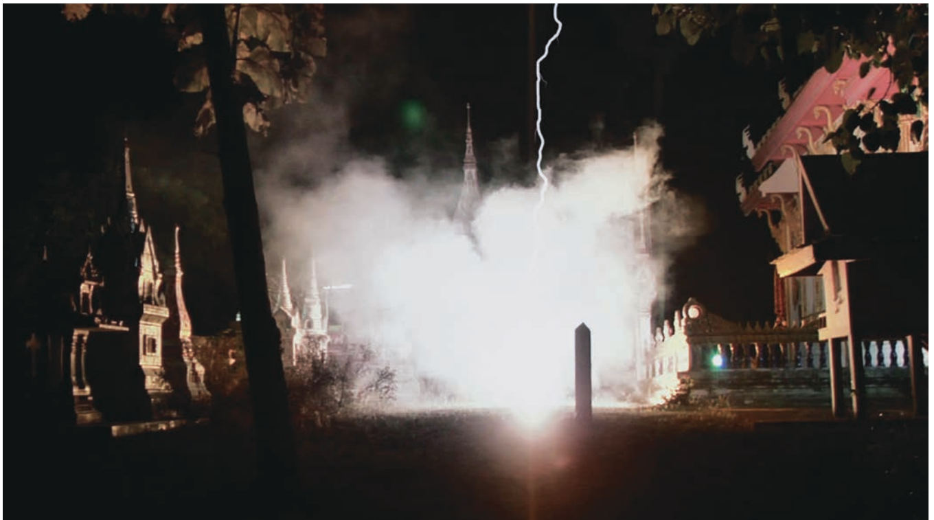
PHANTOMS OF NABUA (2009) de Apichatpong Weerasethakul

Voici donc le cinéma comme machine spatio-temporelle, à l'image de cet étrange vaisseau ovoïde aperçu dans Primitive . Retrouver l'origine (du cinéma), « descendre dans les tréfonds du cinéma » 5 , comme Apichatpong le dit lui-même, – là où se trouvent les fantômes auxquels il faut s'adresser –, cela se fait par une manière de faire cohabiter les strates de temps, les événements en les mettant en rapport, notamment grâce au montage. C'est bien sûr cette préoccupation qui est au cœur même du cinéma de Godard, qui n'a de cesse de réunir ce qui est éloigné afin de créer des chocs poétiques, de produire des rapprochements temporels et historiques révélant des interstices par où surgissent les spectres. Ces