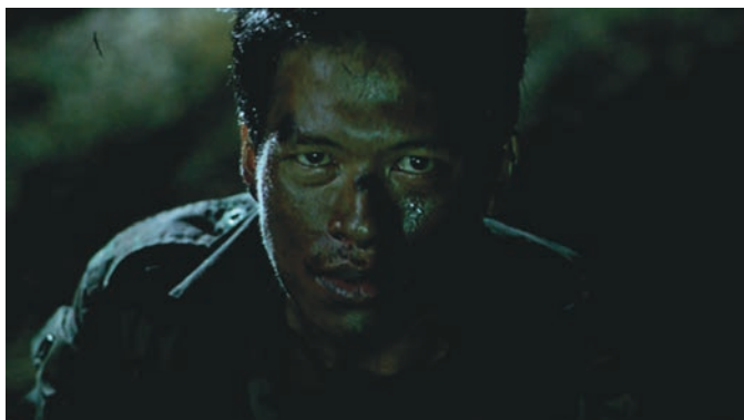
TROPICAL MALADY (2004) d' Apichatpong Weerasethakul