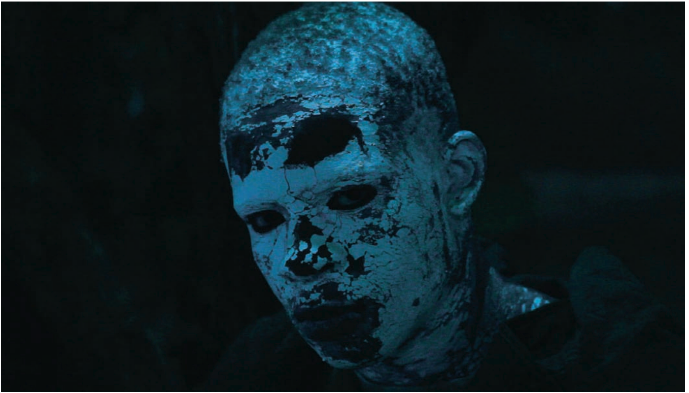
LOWLIFE (2011) de Nicolas Klotz et Élisabeth Perceval

entreprise, avec leurs codes et leurs rites (la rave comme cérémonie païenne), sont aussi possédés : captifs d'un système déréglé animé par une pulsion mortifère, qui les vampirise jusqu'à en faire des morts-vivants.