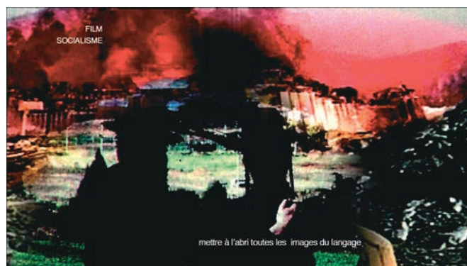
NOTRE MUSIQUE (2004) et FILM SOCIALISME (2010) de Jean-Luc Godard