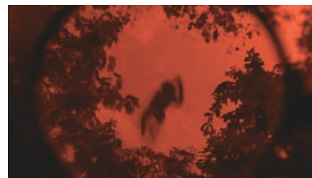
SYNDROMES AND A CENTURY (1), TROPICAL MALADY (2-3-4) et ONCLE BOONMEE... (5)