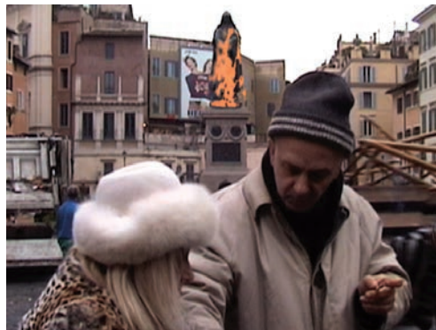
LA STATUE DE GIORDANO BRUNO (2005)

En même temps, l'expérience de La plante humaine , que j'ai réalisé à l'ONF en 1996, n'avait pas été si différente de celle de 49 Flies , puisque ça avait donné lieu à trois ou quatre ans de performances avec des musiciens, ce qui m'avait fait accumuler de la matière. Je devais probablement, à l'époque, être une sorte d'alibi expérimental pour la boîte, parce que ça faisait bien de dire que cette tradition-là subsistait. Mais il y avait quand même, ultimement, l'obligation de réaliser un film. C'est sûr que lorsque j'obtiens une bourse du Conseil des arts, c'est la même chose. Si je décide de faire une demande, c'est que je sais qu'un film va exister. Par contre, Seule la main et 49 Flies n'ont bénéficié que de bourses de déplacement occasionnelles. Il y a aussi le cas de cet étrange projet, Triptyque , qui est certainement la réalisation la plus radicale que j'ai faite : un film abstrait de 30 minutes issu d'une série de performances d'atelier. Personne n'a voulu le montrer parce que ça ne cadre nulle part! Sauf à l'occasion de présentations assez confidentielles (devant des petits publics) au FNC et aux Rendez-vous du cinéma québécois, je l'ai essentiellement présenté lors de rencontres avec des étudiants. L'œuvre demande effectivement des explications car ce projet s'est développé autour de l'idée d'une petite machine formelle qui a eu beaucoup d'importance pour la