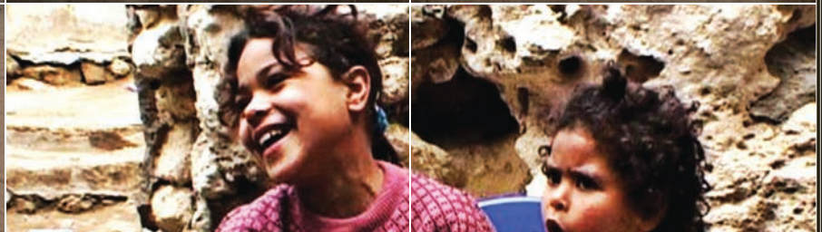
Mafrouza | Emmanuelle Demoris p. 44-45