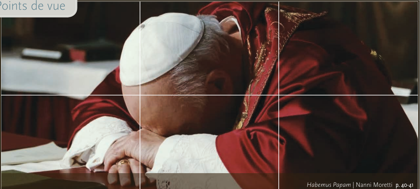
Habemus Papam | Nanni Moretti p. 40-41