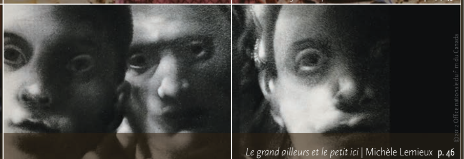
Le grand ailleurs et le petit ici | Michèle Lemieux p. 46