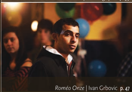
Roméo Onze | Ivan Grbovic p. 47