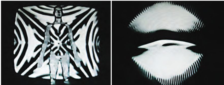
L'AMERTUBE (1972) de Jean-Pierre Boyer

QUAND ON ÉVOQUE L'ART VIDÉO CONTEMPORAIN, ON NE S'ATTARDE PLUS À VANTER CERTAINES MANIPULATIONS optiques du signal vidéo qui firent les beaux jours des œuvres pionnières. Les raisons sont pêle-mêle que le numérique facilite l'accès à d'innombrables effets spéciaux spectaculaires, que les esthétiques visuelles passent de mode de plus en plus vite, que les combats politiques sous-jacents aux expérimentations électroniques de l'image télévisuelle semblent obsolètes.