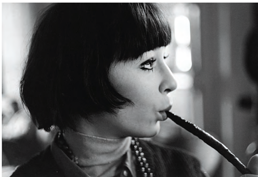
LE CHAT DANS LE SAC