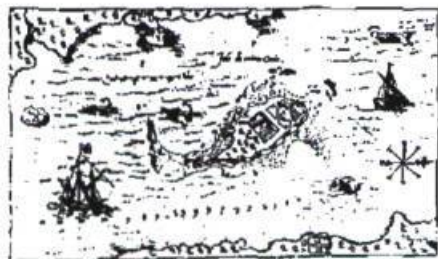
Carte de l'île Sainte-Croix, d'après Samuel de Champlain.

Il faut se rappeler que Louis Hébert est venu en Nouvelle-France durant la période la plus dure, celle des «conquistadors» qui exerçaient un monopole commercial de la fourrure. Lionel Groulx écrit : « Les mercantils ne veulent à aucun prix du plus modeste noyau de communauté humaine qui aurait fatalement ses intérêts propres, lesquels pourraient contrecarrer les intérêts du commerce... Ils abreuveront des pires avanies un colon têtue comme Louis Hébert » 7 . On comprend que Louis Hébert ait pu appuyer la cause des récollets qui demandaient au roi de ne pas en-