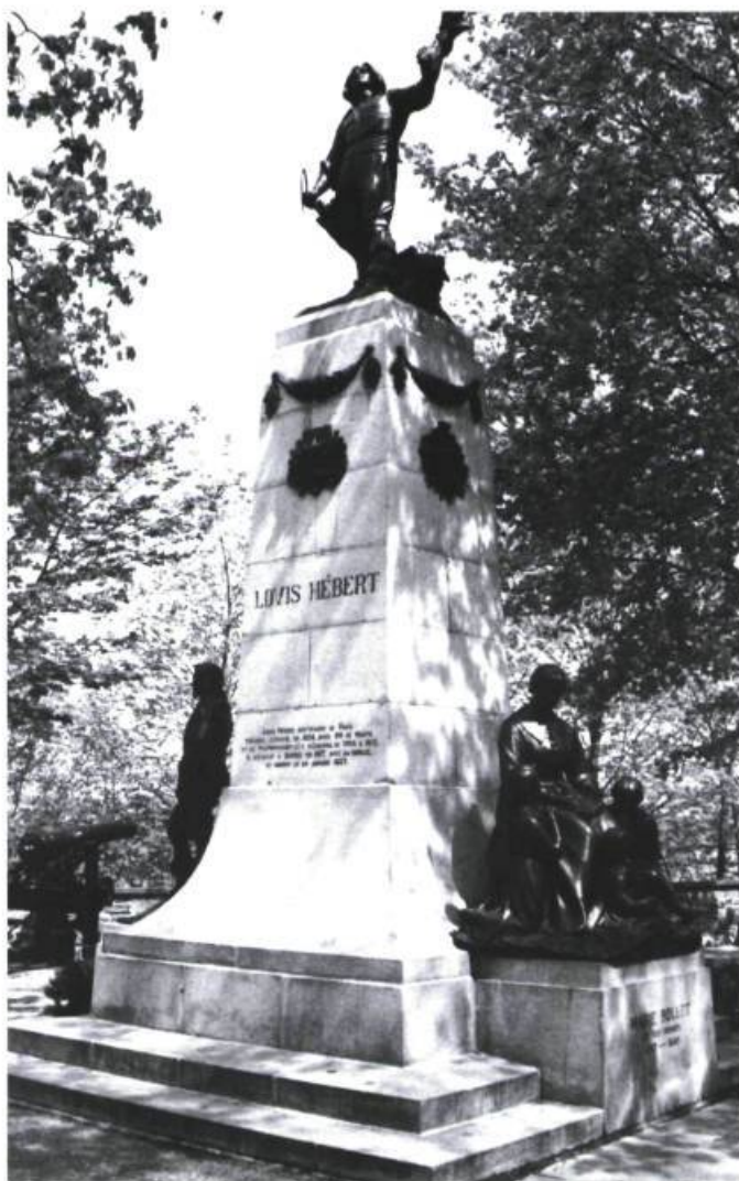
La statue de Louis Hébert, à Québec.