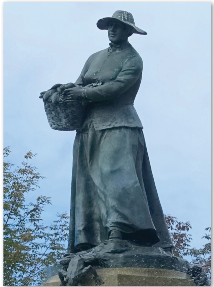
Monument intitulé La Fermière dans Hochelaga-Maisonneuve