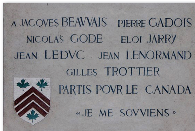
Plaque apposée dans l'Église St-Martin D'Igé.