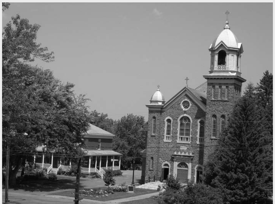
Vue extérieure de l'église Notre-Dame-de-la-Présentation (lieu historique national du Canada), du presbytère et des jardins.

chez-lui, mais aussi la chapelle de l'évêché de Sherbrooke et la cathédrale Assomption de Joliette. Ozias Leduc n'est toutefois pas qu'un peintre religieux, étant reconnu pour l'originalité de ses peintures de chevalet, de ses natures mortes et de ses paysages, et également apprécié comme portraitiste et illustrateur. Il vit entouré d'artistes connus qui fréquentent son atelier: