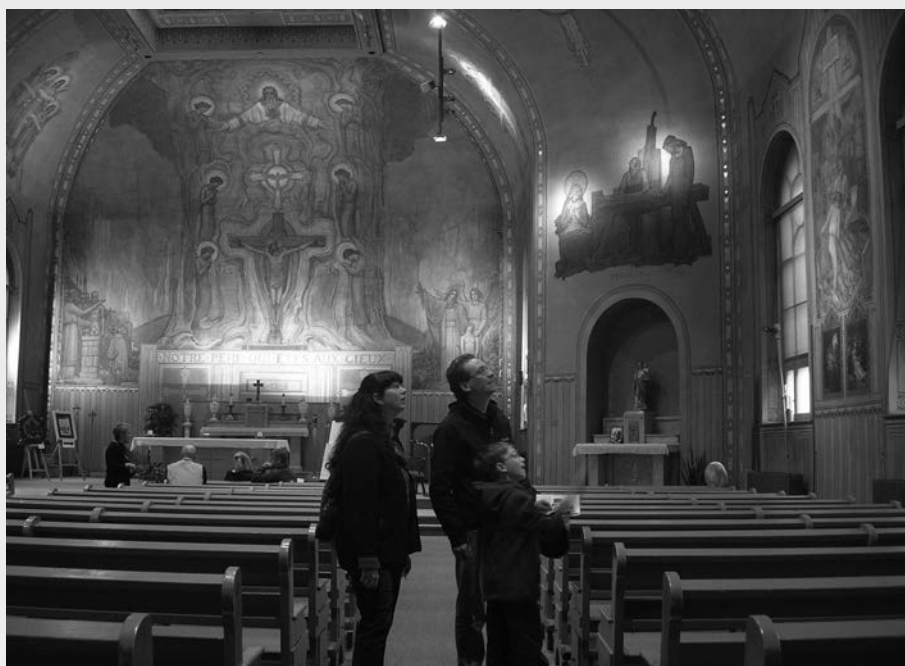
Vue intérieure du décor de l'église Notre-Dame-de-la-Présentation, réalisé par le peintre Ozias Leduc. On y voit l'œuvre du chœur, La Gloire divine , ainsi qu'un aperçu des œuvres de la nef.

En 1975, les œuvres d'Ozias Leduc en l'église Notre-Dame-de-la-Présentation ont été déclarées Biens culturels par le ministère des Affaires culturelles. En 2005, l'église Notre-Dame-de-la-Présentation est désignée lieu historique national du Canada . En 2010, pour le compte de la Corporation culturelle de Shawinigan,