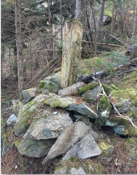
Borne en bois sur le chemin du Portage.

Témiscouata pendant le Régime français à cause des innombrables querelles politiques 1 . Selon lui, les militaires et les Premières Nations utilisaient plutôt un réseau fluvial parsemé de courts portages pour atteindre le lac Témiscouata.