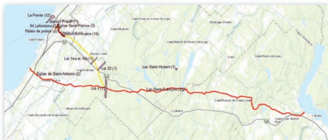
Le nombre de causes par lieux du délit sur le tracé du chemin du Portage entre 1860-1900 (ArcGIS).