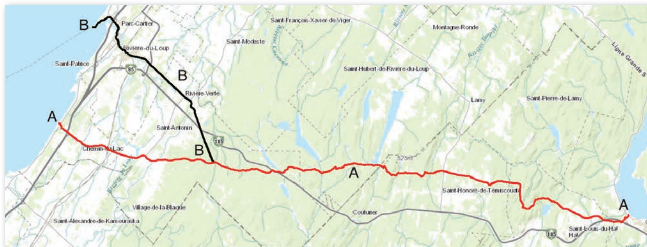
Chemin du Portage de 1783 (tracé A) et le chemin Neuf de 1840 (tracé B) (ArcGIS).