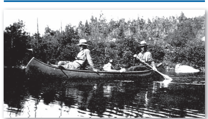
Un guide w8banaki et un client du Club Shooner à Doheny, vers 1930.

En œuvrant au sein des clubs privés de la Mauricie, les W8banakiak entretiennent une forme de mobilité à l'intérieur d'un espace que la Nation arpente depuis les débuts de la colonisation. Forcément, l'apparition de ces clubs n'est pas étrangère à la privatisation des territoires de chasse de la Mauricie fréquentés par les W8banakiak. Malgré les difficultés associées aux effets de la privatisation, il demeure que les W8banakiak ont perpétué leur mobilité grâce à un accès à la forêt qui résulte en partie du métier de guide.