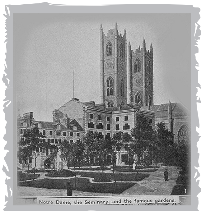
Notre Dame, the Seminary, and the famous gardens.