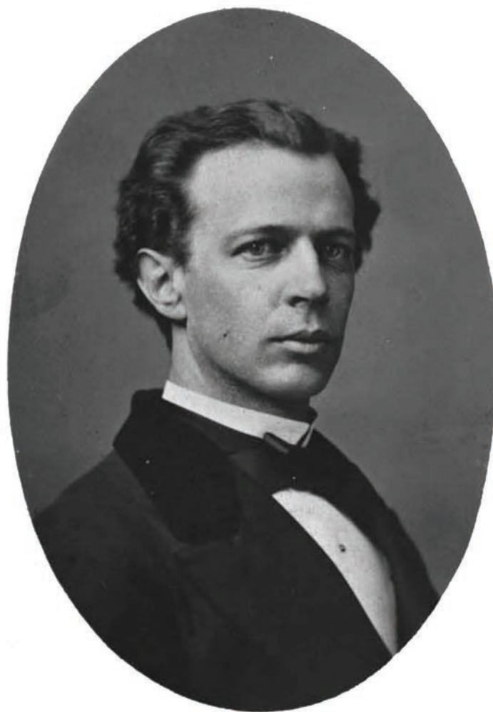
Wilfrid Laurier – 1869.

Wilfrid Laurier naît en 1841, soit quatre ans après la révolte des Patriotes et deux ans après la pendaison de François-Marie-Thomas (Chevalier) de Lorimier. Autre chose connue, que l'on peut affirmer sans crainte, est que le jeune Wilfrid a toujours été attiré par la politique, étant contaminé par ce virus dès son plus jeune âge. Et il ne faut pas chercher très loin pour savoir où il a contracté la maladie. À Saint-Lin, à la résidence familiale des Laurier, il s'agit d'un sujet de conversation