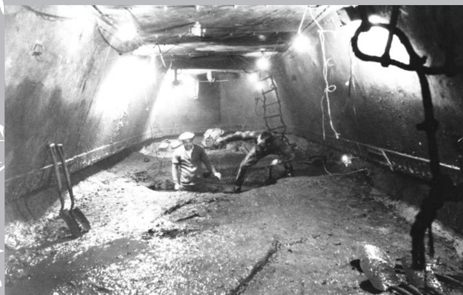
Le 24 juin 1933, lors de la construction du pont du lac Saint-Louis entre Kahnawake et LaSalle : vue de la partie aval du compartiment de travail dans le caisson n° 5, au moment de l'inspection finale du roc à cet endroit.