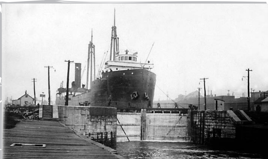
L'écluse n° 1 du canal de Lachine, en 1924. Les deux premières écluses du canal étaient plus vastes et pouvaient accueillir des océaniques dont on transbordait les produits dans des bateaux plus modestes. Ce transbordement favorisa le développement d'entreprises de transformation et stimula l'essor du secteur manufacturier à Montréal.

tiers de la force ouvrière de Montréal. La quête d'énergie (lire énergie hydraulique directe) peu chère et d'eau bon marché compte parmi les principaux facteurs de localisation de ces établissements industriels aux abords de ce canal qui est perçu comme le « berceau de l'industrialisation manufacturière au Canada ».