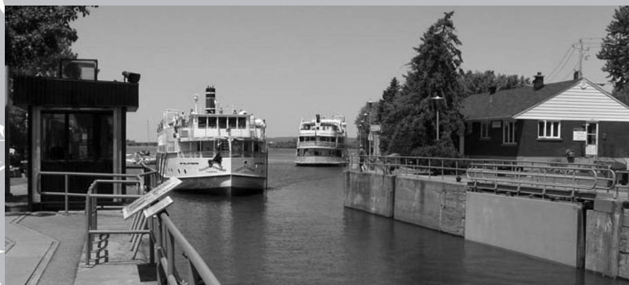
Aujourd'hui, au canal de Sainte-Anne-de-Bellevue, des bateaux de croisière modernes rappellent l'époque où des dizaines de vapeurs sillonnaient l'Outaouais.

D'autres canaux (Grenville, Beauharnois, Soulanges) sont sous la responsabilité de municipalités ou de corporations intermunicipales. Les berges des emplacements historiques reçoivent chaque année des millions de promeneurs, de cyclistes, de patineurs, de passionnés d'histoire et de participants à une multitude d'activités estivales dans un décor splendide. Randonnée pédestre ou cycliste, observation d'oiseaux et de bateaux et croisières patrimoniales ne sont que quelques activités possibles. Les canaux fonctionnels sont des sites de patrimoine vivant où les éclusiers perpétuent les gestes d'antan : accueillir les capitaines, les aider à s'amarrer, les conseiller dans leurs manœuvres et, au canal de Chambly, actionner manuelle-