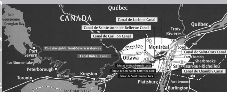
Les canaux navigables du Québec et du Canada.

ment de nombreux mécanismes. Les travailleurs des passages historiques écluent des dizaines de milliers de bateaux de plaisance, ce qui permet aux navigateurs d'aujourd'hui de goûter à un mode de vie ancestral. Des expositions, des activités d'interprétation, des sites Internet et