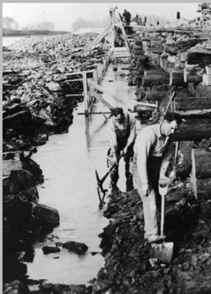
Voici les deux outils qui ont permis de creuser des centaines de kilomètres de canaux. Travailleurs au canal de Sainte-Anne-de-Bellevue, détails, 1920.