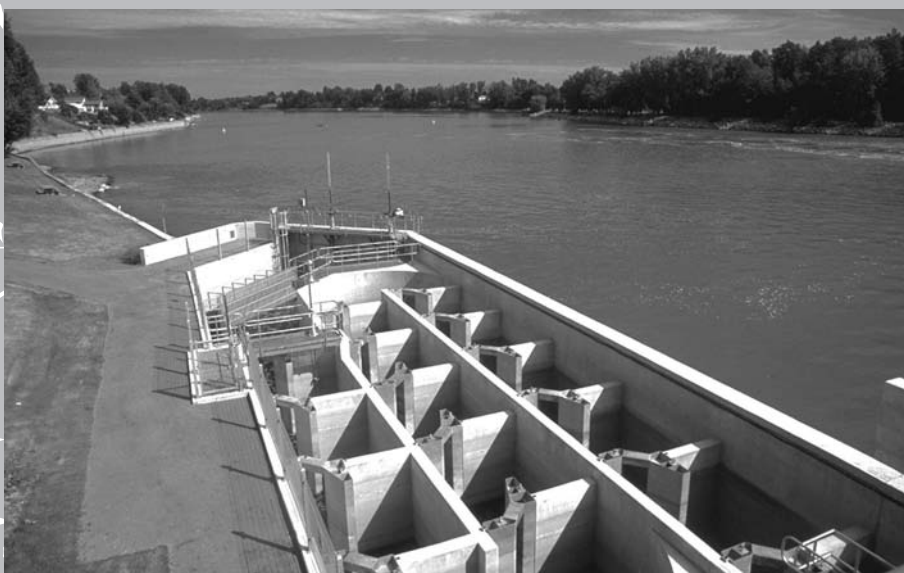
La passe migratoire du canal de Saint-Ours.

Aujourd'hui, au Québec, six canaux relèvent de l'Agence Parcs Canada laquelle assure la conservation et la mise en valeur de ces lieux historiques nationaux (Coteau-du-Lac, le seul fermé à la navigation, Chambly, Lachine, Saint-Ours, Sainte-Anne-de-Bellevue, Carillon). Ces voies constituent un important réseau qui donne