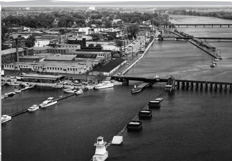
L'entrée sud du canal de Chambly, vers 1960. On peut y percevoir les interactions entre l'industrie et l'ancien port.