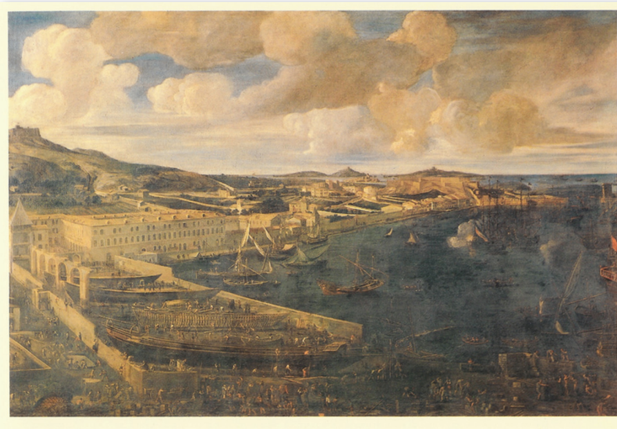
« Arsenal des Galères dans la ville de Marseille », peinture de Jean-Baptiste de La Rose, 1666, Musée de la Marine, Paris, France.

À l'automne 1688, Seignelay prend conscience de la situation alarmante en Nouvelle-France face aux attaques iroquoises (Lachine 1689) et ordonne à Arnoul, l'Intendant des galères, de renvoyer les survivants iroquois depuis Marseille jusqu'à Rochefort, sous la supervision d'un jeune interprète canadien présent à Rochefort comme cadet de marine, Joseph Le Moyne de Sérigny 10 , « avec douces caresses et marque d'affection pour garder la France en bonne grâce... ».