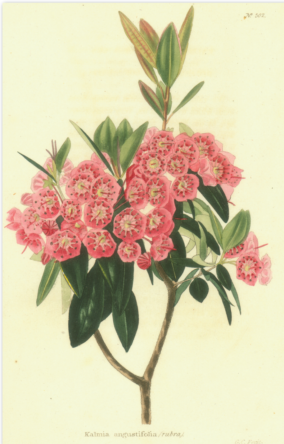
Le kalmia à feuilles étroites.

En 1605, Samuel de Champlain est le premier Européen à décrire en sol nord-américain le topinambour ( Helianthus tuberosus ), une espèce alimentaire apparentée au tournesol ( Helianthus annuus ). Une partie importante du plan d'affaires de Champlain présenté à Paris en 1618 repose sur les revenus générés par la vente de végétaux utilitaires, comme les bois, les plantes à fibres textiles, les gommes et les résines et même une plante tinctoriale au latex rouge (sanguinaire du Canada, Sanguinaria canadensis ) 24 . L'exploitation des ressources naturelles végétales est toujours d'actualité en Nouvelle-France.