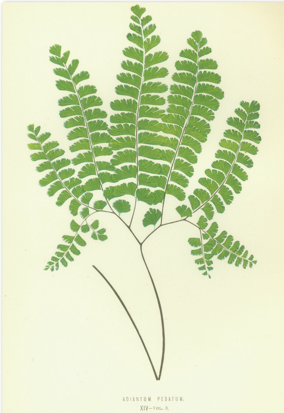
L'adiante du Canada.

Même si l'imprimerie est absente en Nouvelle-France, des livres y circulent, notamment dans les bibliothèques des communautés religieuses. Chez les Jésuites, on recense des livres de médecine et quelques ouvrages de botanique. Au Mexique, une première imprimerie est installée en 1539 par les autorités espagnoles. En 1570, le premier livre de médecine imprimé en Amérique est produit à Mexico. Dans cet ouvrage, une salsepareille médicinale indigène au Mexique est