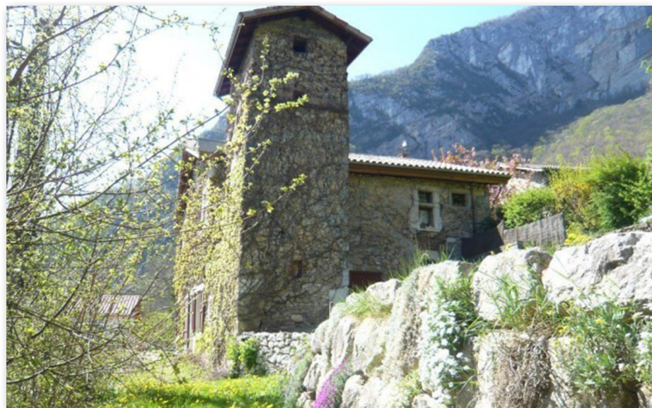
Le château de la famille Saint-Ours à Veurey-Voroize en Isère.

La municipalité de Deschaillons-sur-Saint-Laurent, dans la région de la Mauricie-Bois-Francs, doit aussi son nom au capitaine du régiment de Carignan-Salières pour la seigneurie qui lui a été concédée le 24 avril 1674. Saint-Roch-de-l'Achigan et Saint-Roch-sur-Richelieu doivent aussi leur nom à des membres de la famille Saint-Ours.