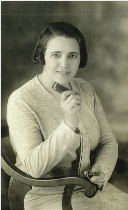
Mary Travers, dite La Bolduc, vers 1930.