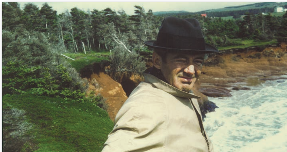
Félix Leclerc en tournée en Gaspésie au début des années 1960.

Par la transmission orale, la chanson folklorique a la particularité de permettre des interprétations multiples, contrairement à la chanson littéraire ou celle transmise par le disque qui offre une version unique. Si la voix demeure l'unique instrument du chanteur traditionnel, la chanson littéraire ou écrite qui se propage dans les années 1930, entre autres par La Bolduc et le mouvement de La Bonne Chanson , se fait maintenant accompagner d'un piano ou d'une guitare.