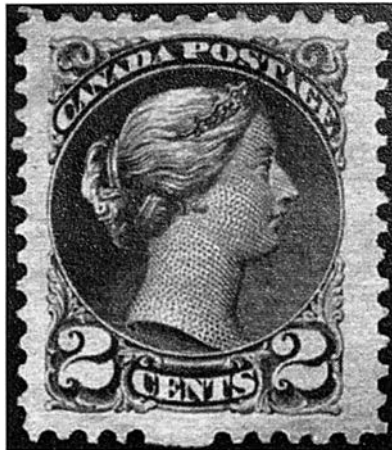
Timbre de l'émission «Petites Reines»

Les premières émissions qu'elle réalisa furent les figures de la reine Victoria que l'on connaît aujourd'hui sous les noms de «Grandes Reines» et «Petites Reines» et qui virent respectivement le jour le 1 er avril 1868 (1/2 cent à 15 cents) et en 1870. Le design original des «Grosses Reines» (1868) fut transformé en un format