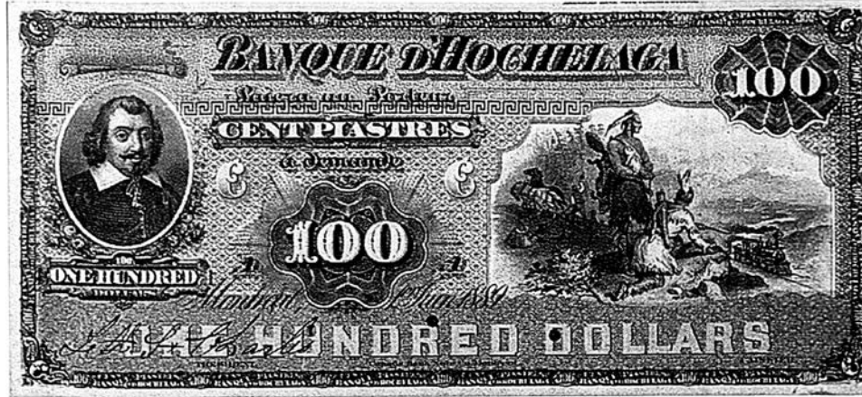
Billet de banque de la Banque d'Hochelaga imprimé par la BABN à Montréal.

Il y avait 37 banques privées au Canada lors de la Confédération. Lors des 62 années suivantes, 37 nouvelles banques furent créées, 29 firent faillite et 35 banques fermèrent ou furent absorbées par la concurrence. En 1935, il n'en restait que 10. Ces banques émettaient toutes leurs propres billets de banque jusqu'à la constitution de la Banque du Canada qui désormais se chargerait de l'émission des billets de banques canadiens. La BABN au cours des années a conçu et réalisé des billets de banque pour pas moins de 67 différentes banques canadiennes et pour d'autres pays en plus d'imprimer des actions de bourse et différentes formes de valeurs fiduciaires. La plupart des billets gravés étaient imprimés en deux couleurs (habituellement le vert «Matthew's Patent Green Tint» et le noir) mais certaines banques y ajoutèrent des couleurs qui font de ces billets de véritables œuvres d'art. Les billets de La Banque d'Hochelaga (jaune, bleu, orange et rouge) en sont un exemple.