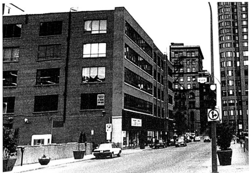
Le nouvel édifice Burland-Desbarats , coin Bleury et Craig (St-Antoine). L'Opinion Publique , 1 er juillet 1875 et le site tel qu'il apparaît aujourd'hui.