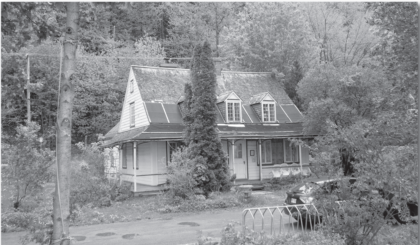
Vue générale de la maison natale de Louis Fréchette, en attente de sa restauration au printemps 2013