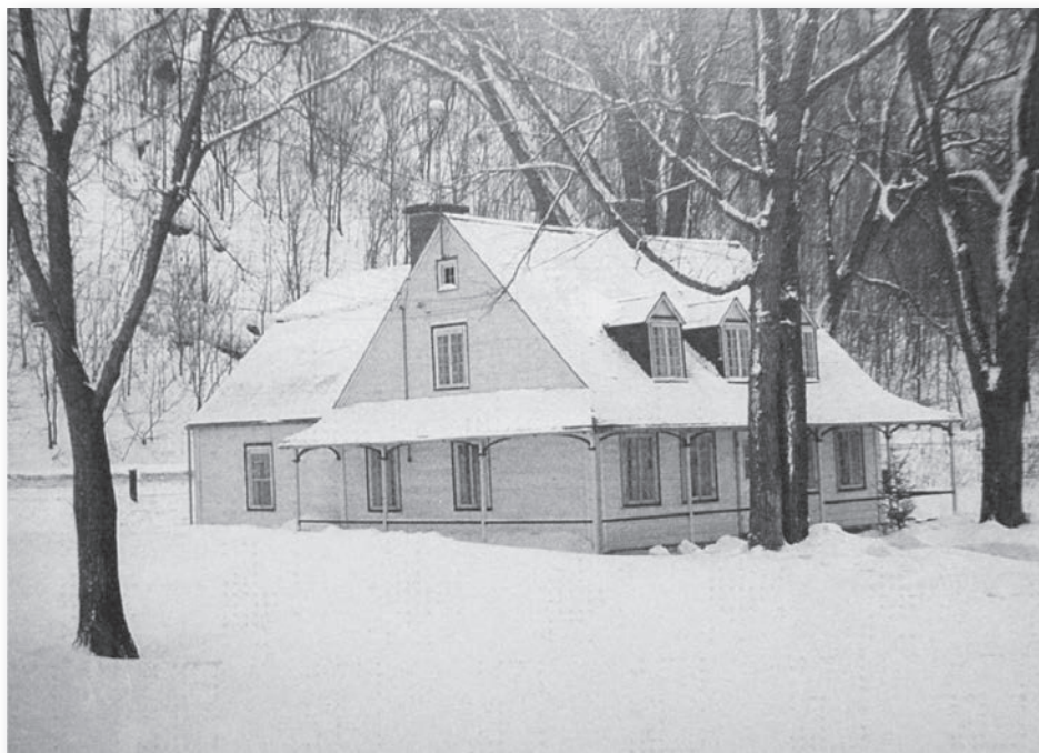
Maison natale de Louis Fréchette sous la neige vers le milieu du xx e siècle