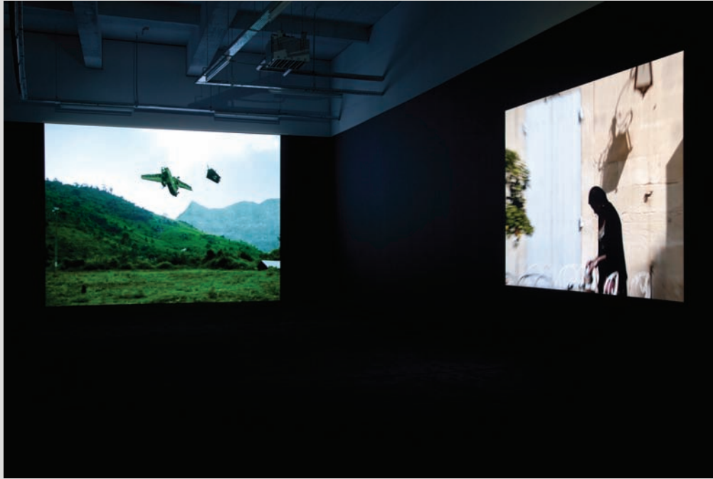
David Claerbout, exposition The Time that Remains .