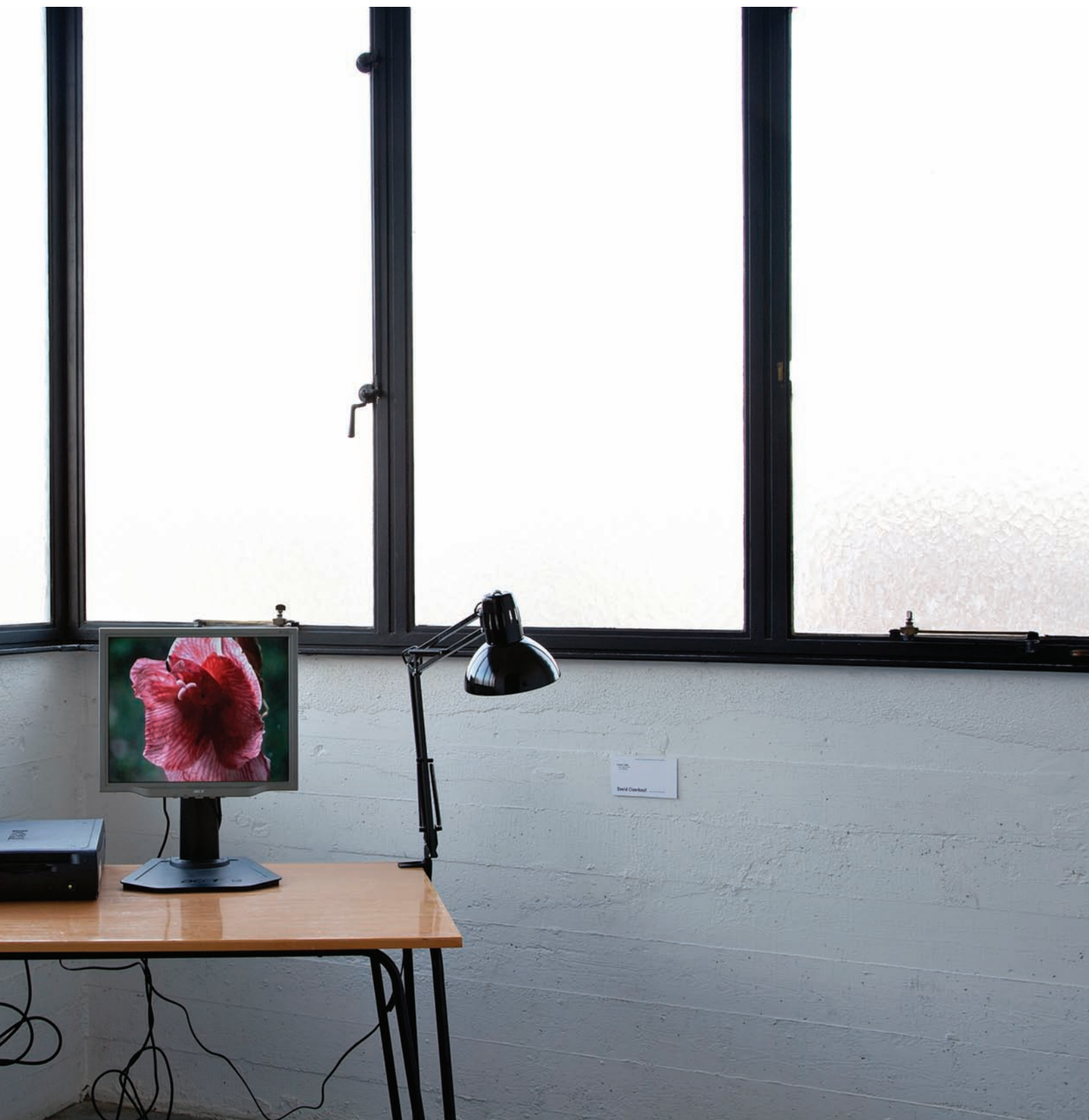
David Claerbout, exposition The Time that Remains .

(performance, modulation de la luminosité, projection différée des films, écran s'abaissant et se relevant, etc.) mettaient littéralement en scène l'œuvre de Parreno et ses multiples temporalités. La scénographie, savamment orchestrée, devenait ainsi un principe temporel. Elle remettait en cause notre approche habituelle de l'exposition en soulignant notamment ses liens avec le spectacle et le cinéma. Par comparaison, l'exposition de Claerbout, bien que captivante,