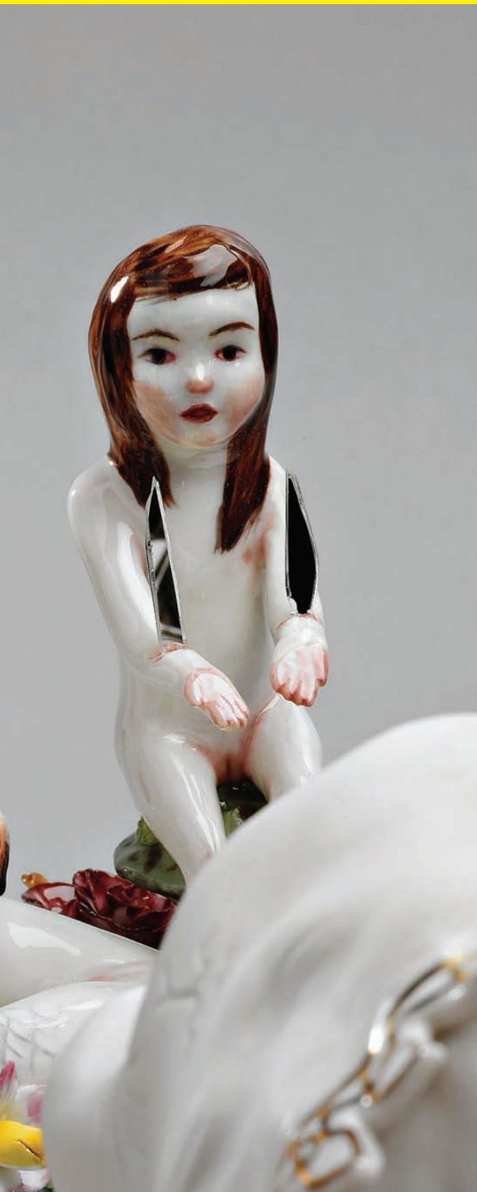
Shary Boyle, The Rejection of Pluto (détail), 2008. Porcelaine, émail, diodes électroluminescentes éteintes; 36 x 25 x 20 cm.