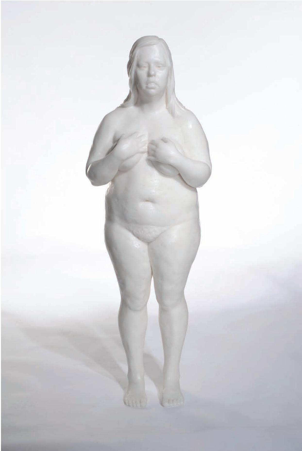
Fred Laforge, Fille trisomique , 2008. Cire; 155 x 51 x 35 cm.