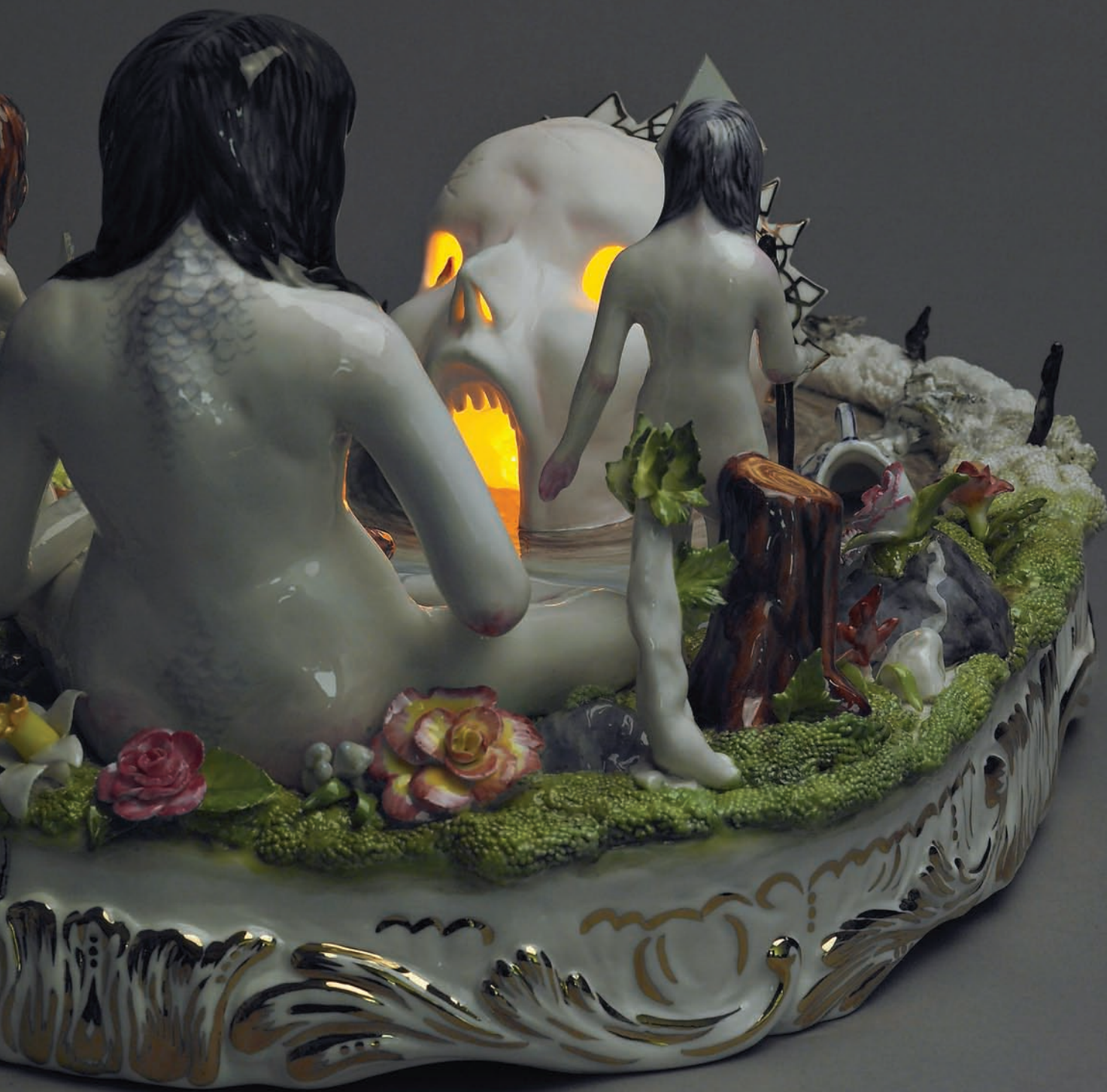
Shary Boyle, The Rejection of Pluto (détail), 2008. Porcelaine, émail, diodes électroluminescentes allumées; 36 x 25 x 20 cm.