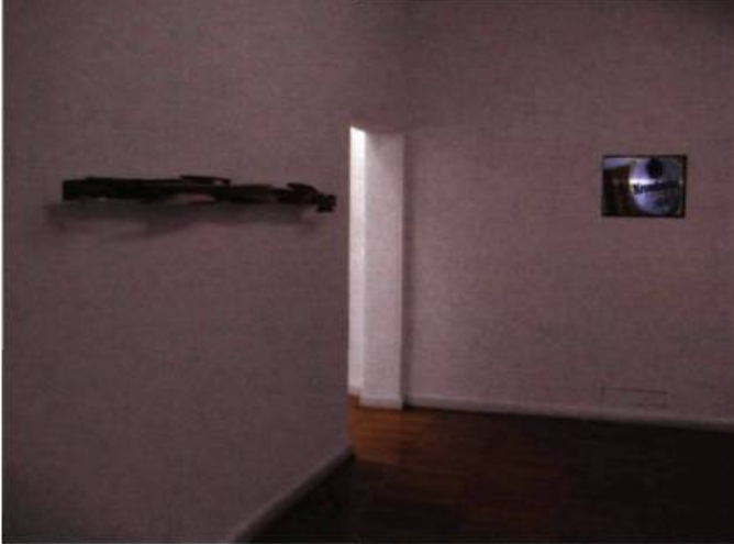
Vue partielle de l'exposition Anstoß Berlin .

explorent des univers esthétiques et des réalités foncièrement diversifiés, Berlin se confine à une succession d'images télé quelconques et irritantes. 4