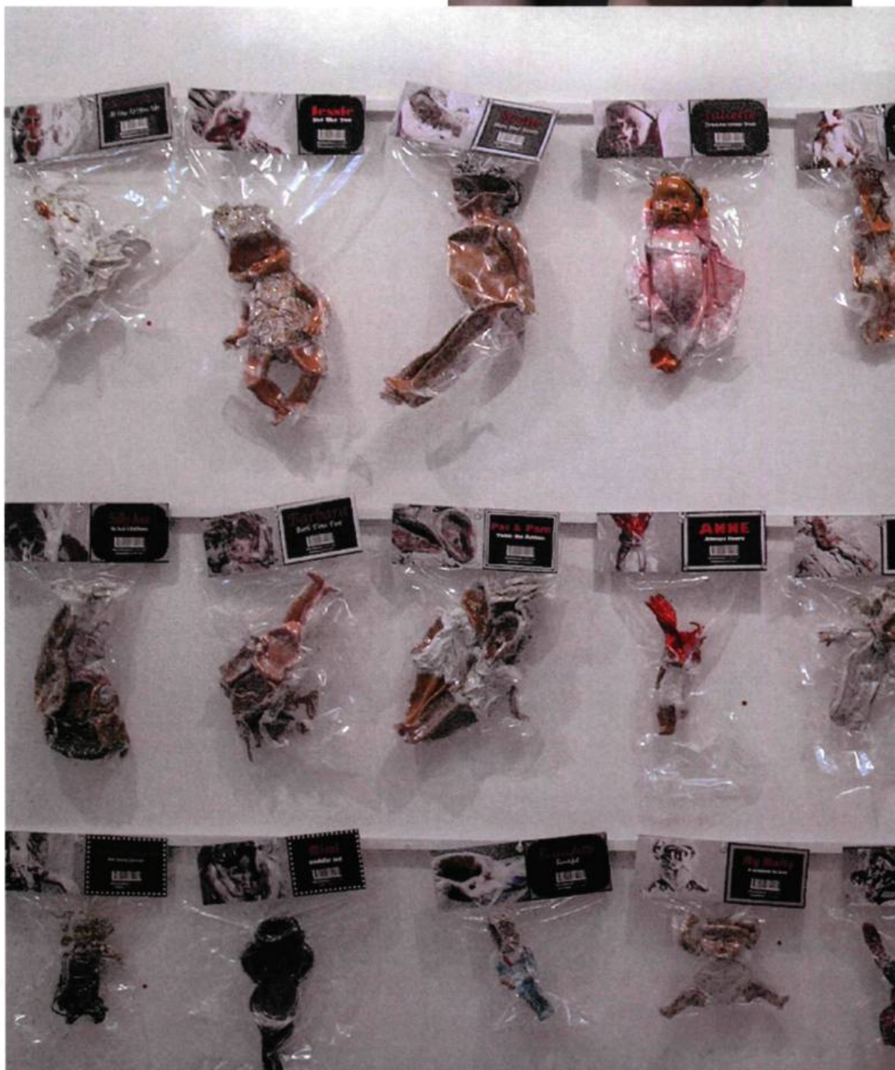
Julianne Rose, Armed Response #14, 26, 27, 2006. Tirage lambda contrecollé sur aluminium, sous Diasec mat. Édition de 8 + 1 e.a.