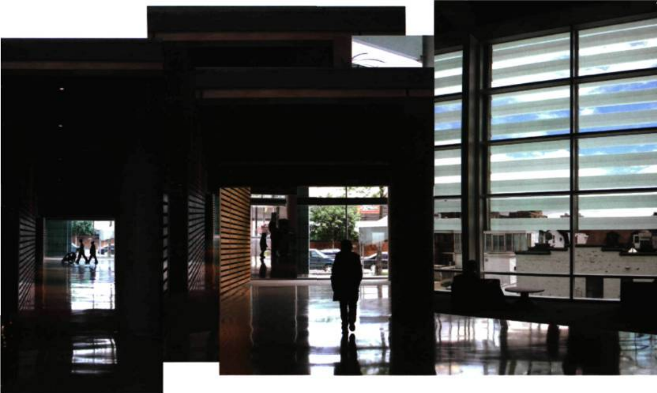
Christiane Desjardins, Ils y étaient , 2006. Impression au jet d'encre; 78 x 111 cm. Édition de 6.

ques partitions d'une même feuille sont envahies de texte. L'écrit devient ainsi passage obligé. Les mots, les lettres tracées distillent, en d'illusoires modes d'emploi, leitmotive et recommandations. Cet envoi de notes surgit comme en rupture face à la silhouette multipliée de mêmes protagonistes en différentes zones de la feuille. Si insistant, le texte écrase les images au lieu de les accompagner. Le message visuel est parasité et la relation entre ce qu'on lit et ce qu'on voit est perturbée.