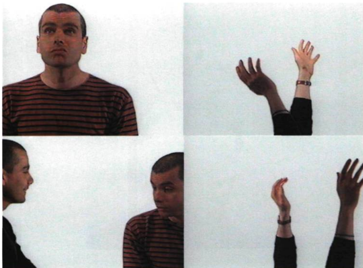
John Zeppetelli, Unbound , 2000. Vidéo VHS 5 mn. (Extraits)

spectateur... Les œuvres contemporaines complexifient cette question avec une distance ironique ou avec l'utilisation de nouvelles techniques, mais elles montrent en fait ce qui a constitué le grand paradoxe de l'autoportrait depuis ses premières apparitions : l'identité de l'artiste demeure un manque constant en tant que preuve, mais elle s'impose toujours comme sens référentiel indispensable.