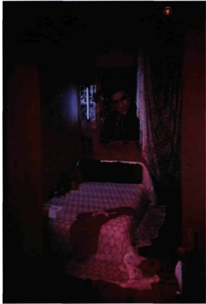
Jean-Christian Bourcart, Série des Madones infertiles , 1992.

Les sensations différentes selon les procédés et les perceptions de nature plurisensorielle (Kinesthésiques, auditives, visuelles, tactiles) désignent autre chose que l'œuvre inanimé; elles assignent le spectateur dans son état d'être vivant dans un fragment de réel. « Toutes les inventions et les technologies sont des prolongements ou autoamputations de nos corps; et des prolongements comme ceux-là nécessitent l'établissement de nouveaux rapports ou d'un nouvel équilibre des autres organes ou des autres prolongements du corps » 2 . Les éléments technologiques autant que les signes linguistiques et les éléments plastiques évoquent le monde (lieu discursif) où nous vivons. Le spectateur est un motif intégré. « Le logiciel humain, l'esprit, y intègre les informations venues des autres sens »