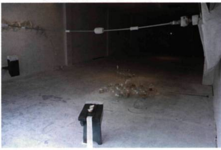
Guy Blackburn, Quémander de l'affection (Essai sur la fragilité) , 1997. Détail.

descend au plancher et se ramifie vers tous les murs. Au quadrillage radical de Poitras et à la dramatique émotive d'un Blackburn, Robertson ajoute la vision circoncentrique amérindienne bienfaisante. Suspension et circularité.