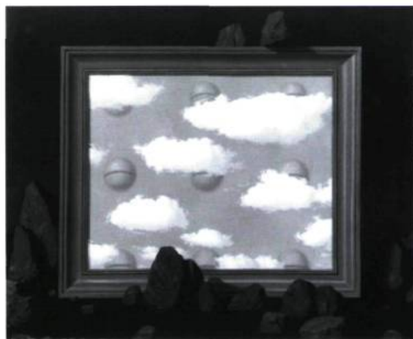
René Magritte, La grande marée , 1951. Huile sur toile; 65 x 80 cm. Collection particulière, Bruxelles. © René Magritte/Charly Herscovici, Kinémage, 1996.

Magritte pense, comme il le dit lui-même, en images, il se fait à la fois poète et voyant. Le pictural est forcément dans la poésie et la poésie, lorsqu'elle est transcrite, du moins par sa calligraphie, tisse son fil interrompu de silence, de