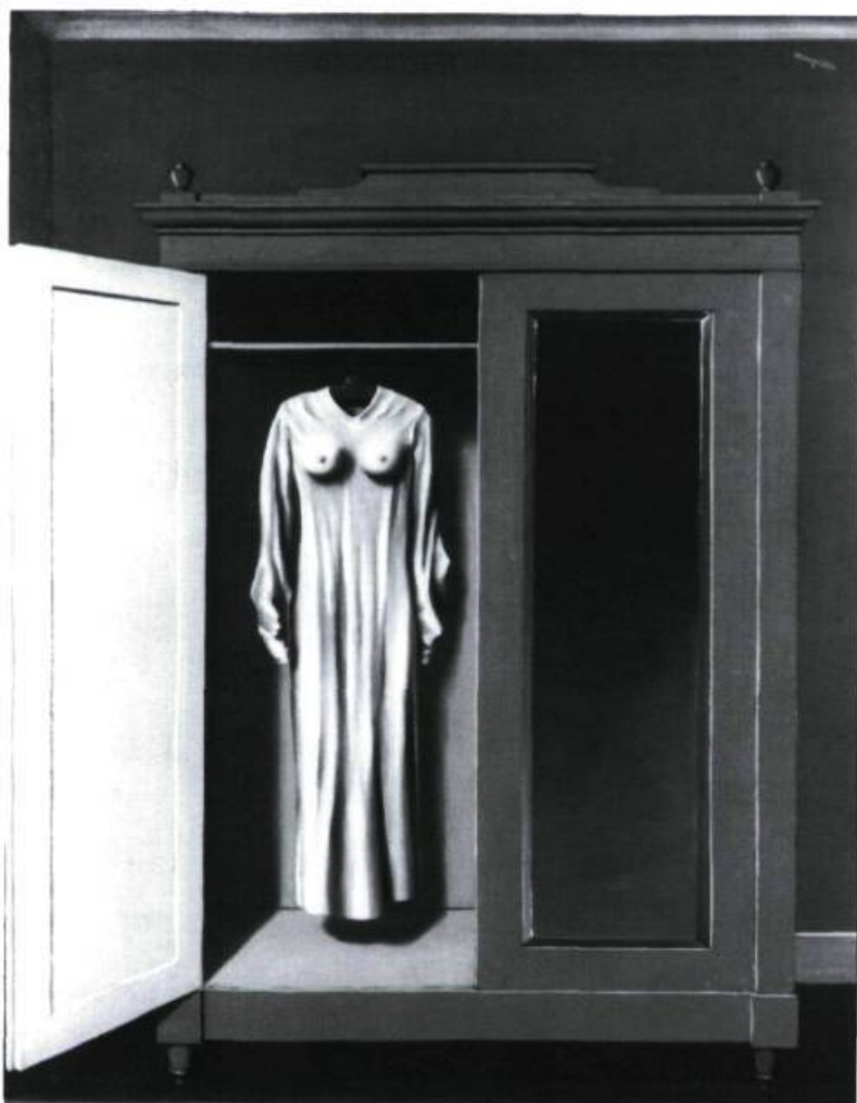
René Magritte, In memoriam Mack Sennett , 1936. Huile sur toile; 73 x 55 cm. Ville de La Louvière (Belgique).

avec la notion de « représentation », au sens où l'entendait jusqu'au début de ce siècle l'histoire de l'art : la mimesis est pour lui un faux problème, l'apport de Freud ayant démontré la valeur déjà toute fictive qu'il y a à « se représenter ». Magritte présente, plus qu'il ne représente.