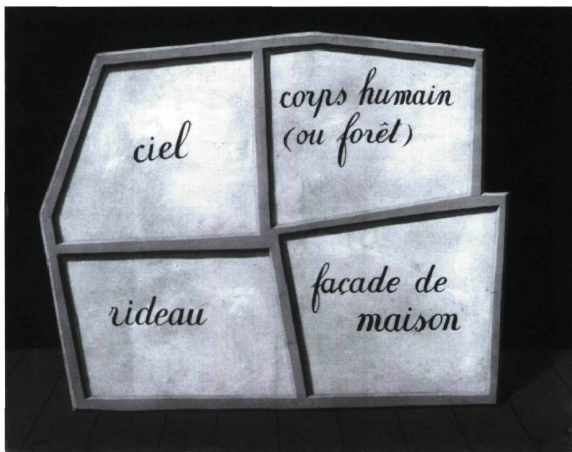
René Magritte, Le masque vide, 1928. Huile sur toile; 73 x 92, 5/93,5 x 113 cm. Collection Kunstsammlung Nordrhein-Westfalen, Düsseldorf.

Les trois pans de rideau non pas tendus mais placés dans un espace irréel, retenus indéfiniment par leurs attaches, peuvent évoquer sa mère qui a définitivement tiré les rideaux sur sa propre vie : alors que Magritte n'avait que quatorze ans, celle-ci se suicide, se jette dans la Sambre. Le grelot, représentant le bruit en tant qu'élément, évoque peut-être, pour sa part, un tintement réveillant de l'effroi tout en le recouvrant. Magritte, qui a écrit et su très bien parler de son œuvre et de lui-même, fut vague sur cet événement tragique de sa vie, comme il l'a été sur son père qui était négocier.