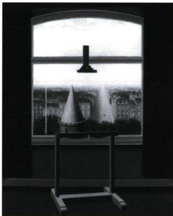
René Magritte, Les promenades d'Euclide , 1955. Huile sur toile; 162 x 130 cm. Collection Minneapolis Institute of Arts, The William Hood Dunwoody Fund. © René Magritte/Charly Herscovici, Kinéimage, 1996.

Une sculpture d'assez grandes dimensions intitulée La Joconde (1967), présente sur une dalle de bronze rectangulaire, un grelot associé à trois pans de rideau retenus aux tiers de leurs longueurs par des attaches elles aussi en bronze. Les titres d'œuvres ne sont jamais choisis à la légère