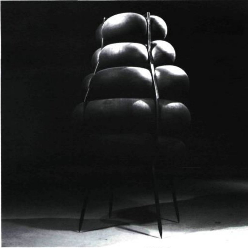
Pierre Bourgoult Legros, Viens t'en, moi je m'en vais , 1992. Chambres à air et acier.

ture Monument pour L de l'artiste Rose-Marie Goulet. Installation en plusieurs sections, elle est composée de trois mots en lettres d'acier peint : Partir, dérivèrent et horizon. L'œuvre est profondément narrative tant par l'emploi des mots que par l'utilisation de traces de pas en acier, incrustées dans le sol, allant et venant autour des objets, suggérant le passage théorique d'autres personnes, suggérant même d'emprunter un tel parcours : on se sent impliqué et questionné par une histoire de voyage et de dérive.