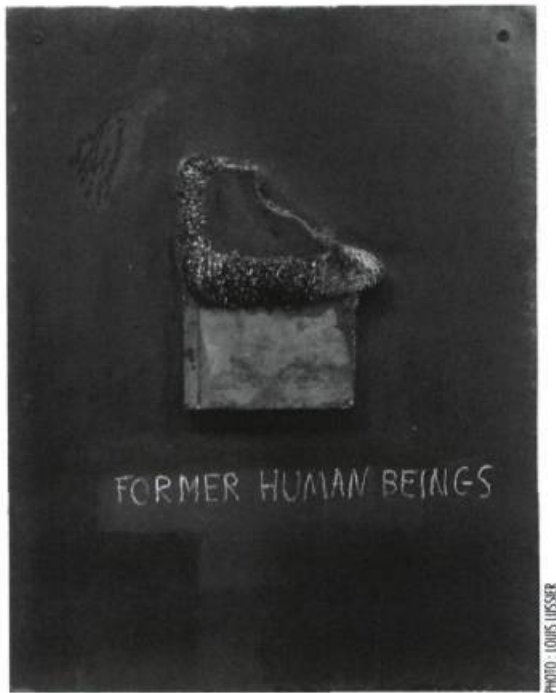
Betty Goodwin, Steel Notes (Former Human Beings) , 1988-89. Cire, pastel et métal ; 52 cm x 40 cm. Galerie René Blouin.