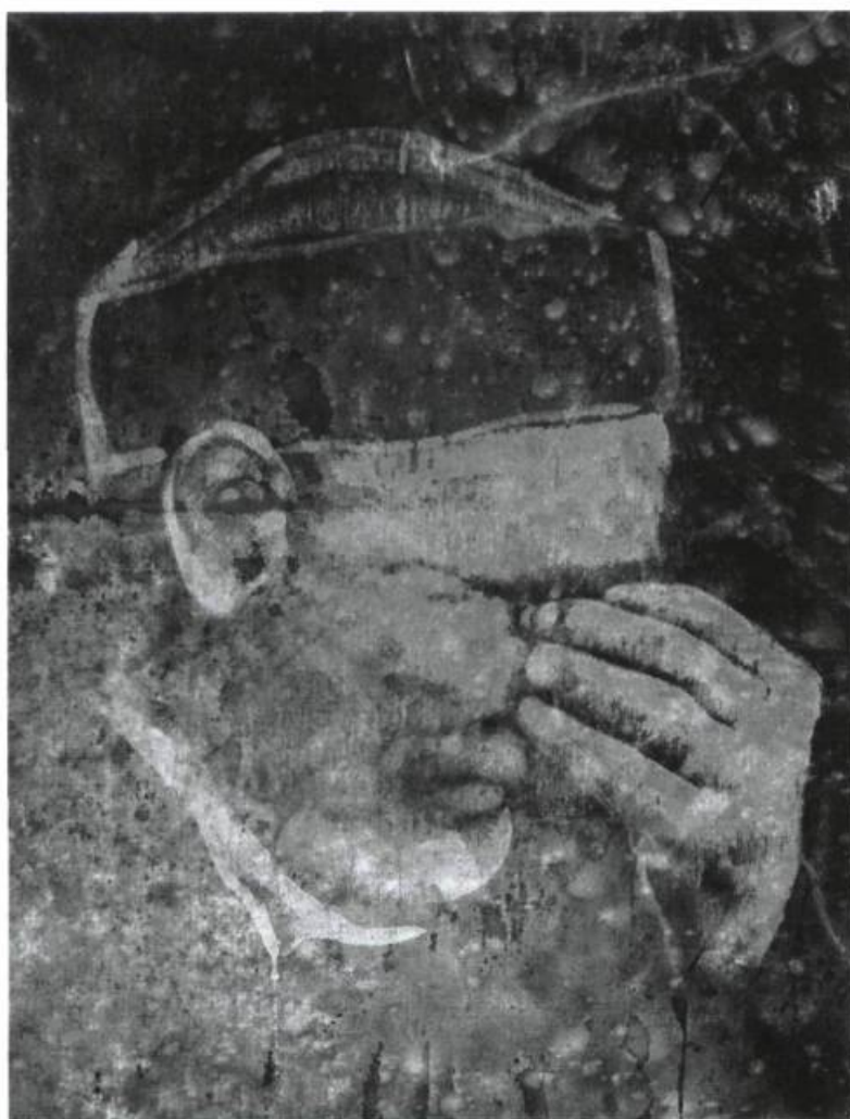
Richard-Max Tremblay, Étude pour Praying #1 , 1989. Acrylique sur toile ; 61 cm x 46 cm.