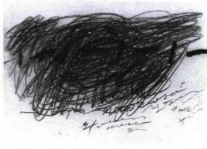
A. Tapiés, L'écriture , 1988. Gravure ; 35 cm x 50 cm. Galerie Simon Blais, Montréal.

récent séjour au Mexique, cherche à transposer en images le choc d'une culture qui est élaborée par la pensée magique et confrontée aux actuelles préoccupations écologiques.