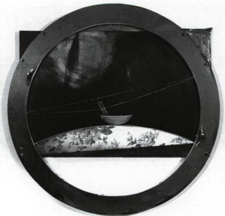
Danielle April, Paysage aux trois cailloux , 1990. Tissus, acrylique, bois, métal ; 102 cm x 102 cm. Galerie Estampe Plus, Québec.