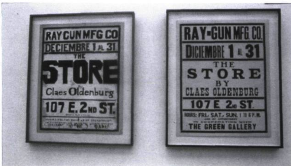
Claes Oldenburg, The store , 1961. Collage, encre, gouache; 21.7 x 55.9 cm. Photo : gracieuseté du Musée d'art contemporain de Montréal

temporelles, des faits plus ou moins arbitraires, des paternités et filiations plus ou moins boiteuses ou insatisfaisantes. Cependant, l'autre excès serait d'adopter une vision trans-historique, non contingente, et supposerait un nivellement des intentions, des formes et des innovations tout autant que des traditions. L'écueil en serait une mise en à-plat formalisatrice «formalisante» et une ignorance systématique, un oubli?, de ce que supposent historiquement de force, de conviction, de luttes et d'ébranlement les conquêtes de l'expression libre et la transformation du sens humain, au sens où l'entendait Panofsky, par les formes.