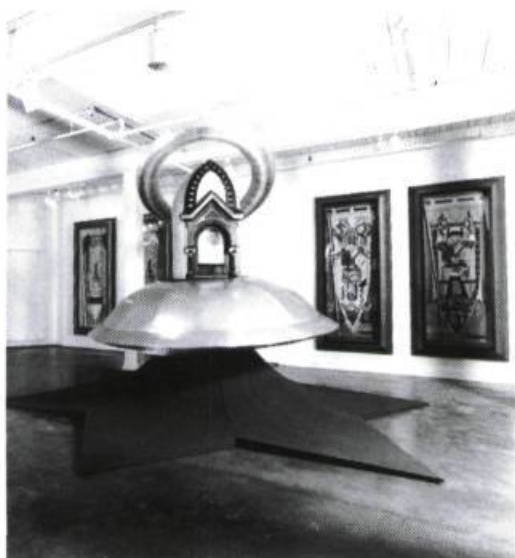
Denis Rousseau, L'Installation de l'indifférence (vue partielle).

Denis Rousseau, galerie Christiane Chassay, du 4 au 25 février 1989 —