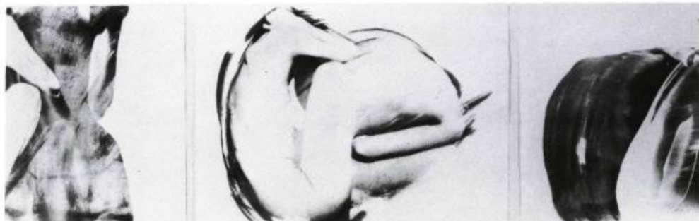
Ariane Thézé, L'Éternel Retour No 15, No 4, No 5, 1989. Cyanotype sur papier: 79 x 54 cm

Ariane Thézé, galerie Axe NEO-7, Hull, du 5 au 29 avril 1989 —