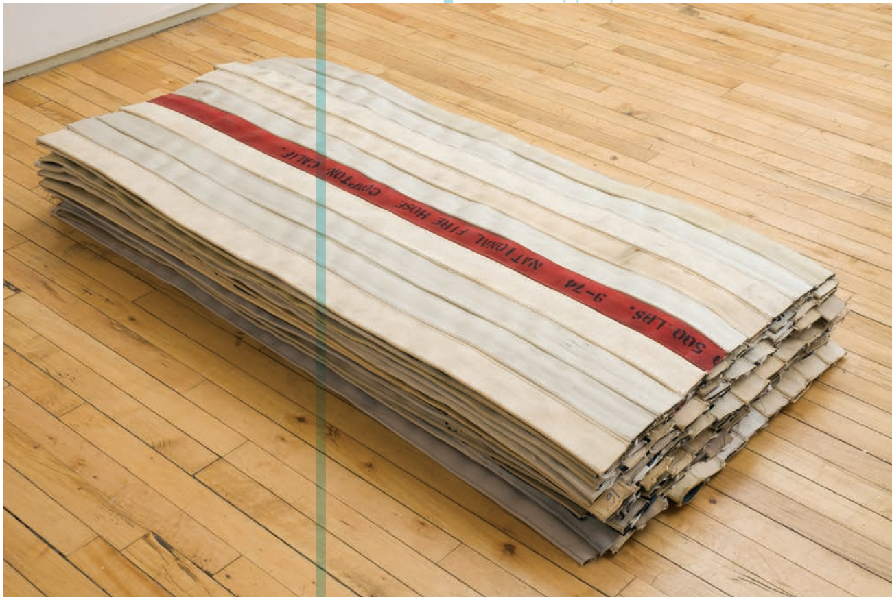
Theaster Gates, Civil Throw Rugs I , 2011.