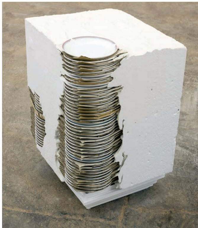
Theaster Gates, Untitled (Plates) , 2011.

ainsi territoire 3 ». L'identité-relation, en revanche, « ne conçoit aucune légitimité comme garante de son droit, mais circule dans une étendue nouvelle ». Elle « ne représente pas une terre comme un territoire, d'où on projette vers d'autres territoires, mais comme un lieu où on "donne-avec" en place de "com-prendre" 4 ». En exploitant un héritage d'une cruauté et d'une violence sans mesure, et en représentant celui-ci au moyen d'un langage formel à l'image de cette puissance monolithique, il semble que Gates présente une oppression qui constitue un noyau irréductible de l'identité noire, véritable définition d'un enracinement. Cependant, en créant un système dans lequel la vente et l'exposition d'objets qui renvoient à l'histoire noire profitent à des centres communautaires noirs mis sur pied par lui-même (et dont l'avenir ne peut qu'être incertain), l'artiste crée un cadre dynamique qui privilégie une vision kaléidoscopique de la notion de race aux États-Unis.