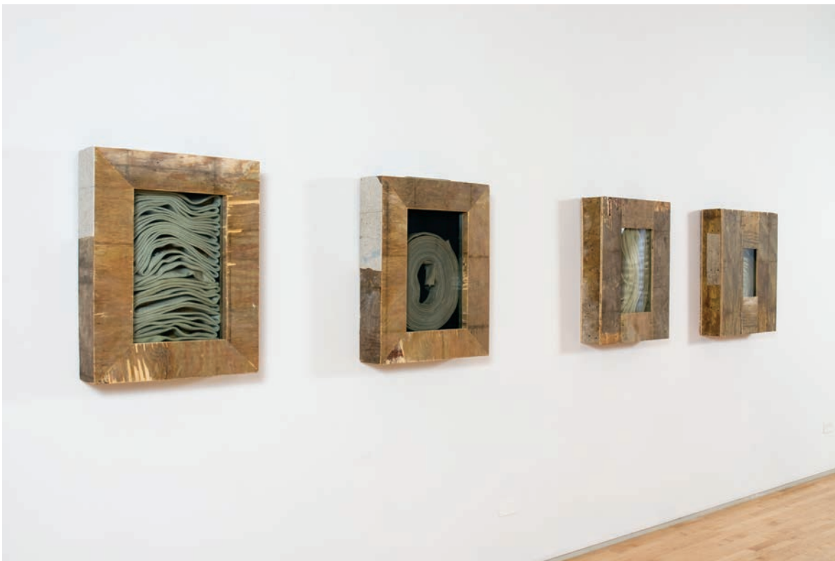
Theaster Gates, Love Seat , 2011. Theaster Gates, An Epitaph for Civil Rights and Other Domesticated Structures , 2011.