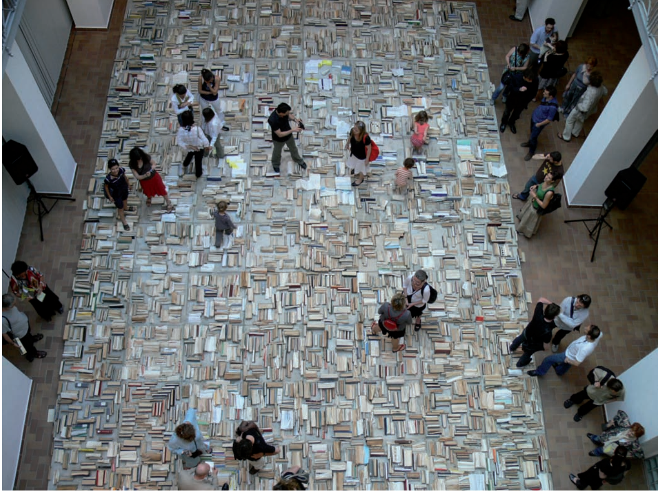
Blinken OSA Archivum Concrete Exhibition , vue d'installation | installation view, Galeria Centralis, Budapest, 2008.