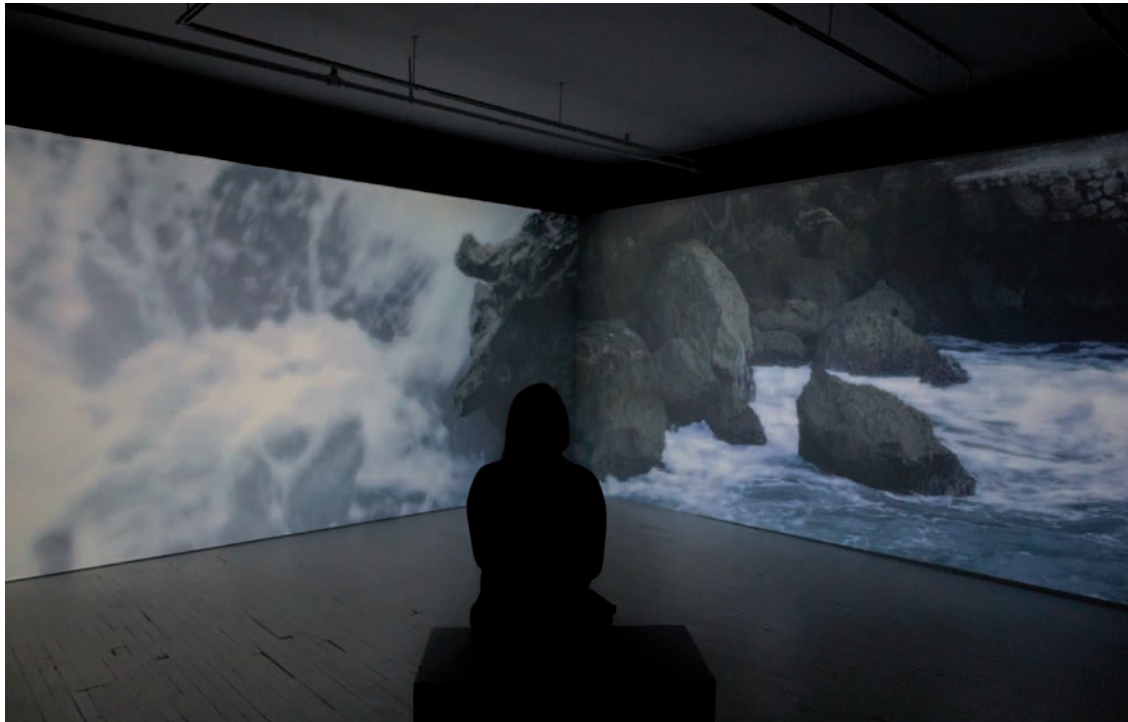
Nelly-Ève Rajotte Claustrophobie des grands espaces , 2016, vues d'installation | installation views, CIRCA art actuel, Montréal.