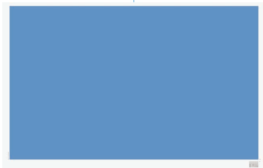
Walid Raad, Secrets in the Open Sea (détails | details), 1994-2004.