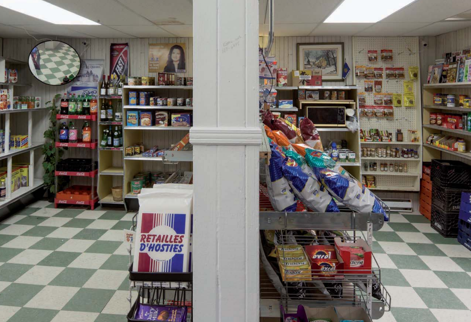
BGL, Canadassimo , 2015 (détails, en cours de réalisation | details, work in progress).