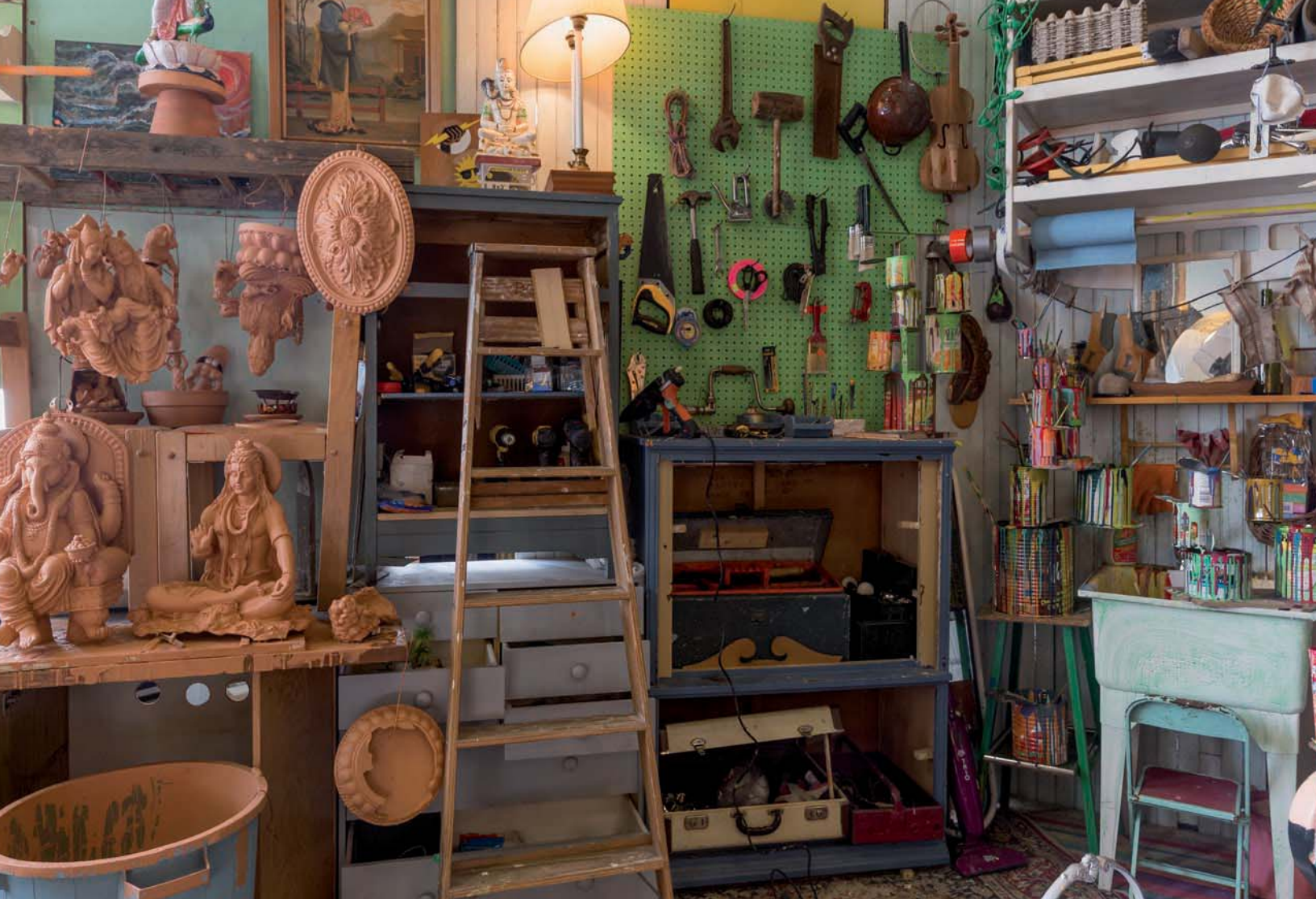
BGL, Canadassimo , 2015 (détails, en cours de réalisation | details, work in progress).