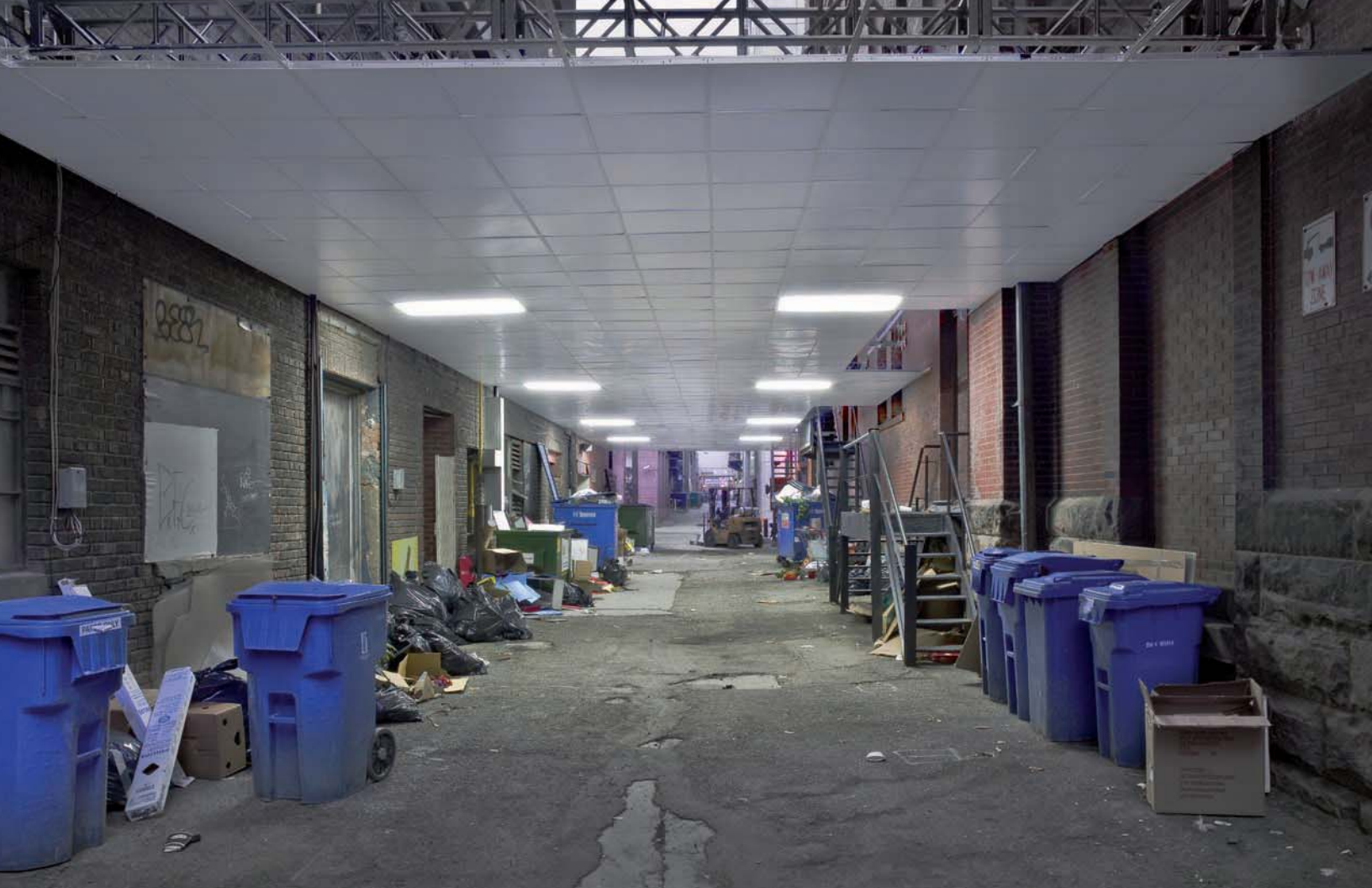
BGL, Spectacle + Problème , 2011.