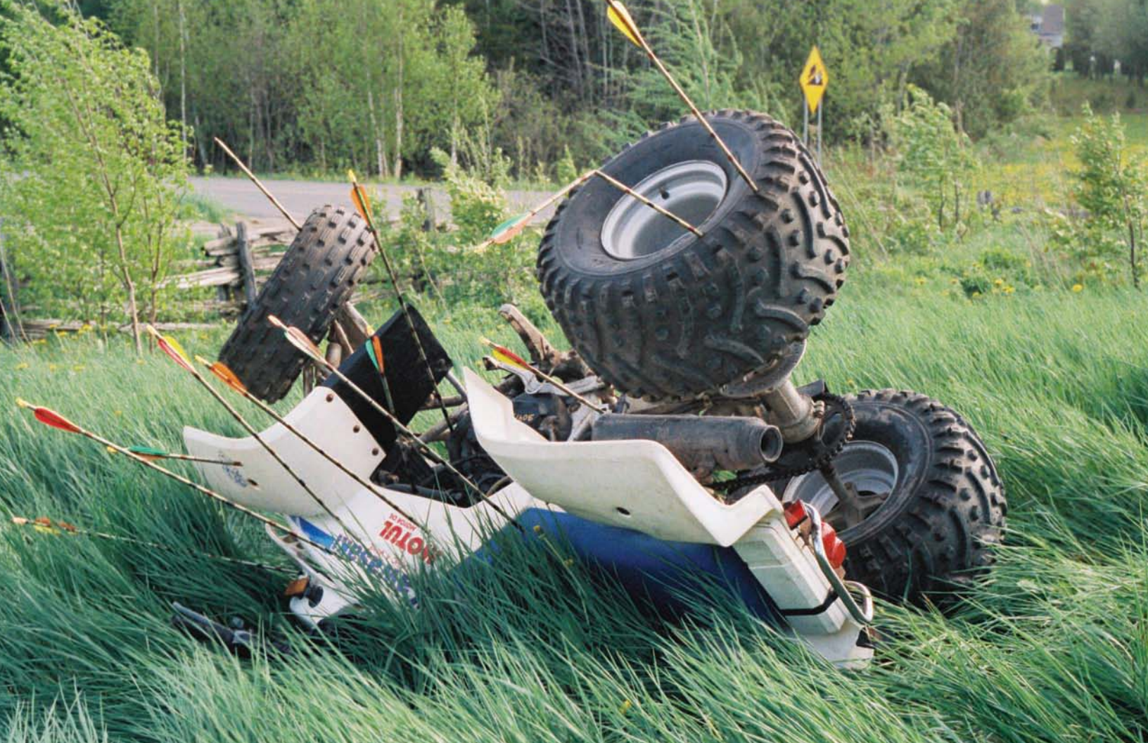
BGL, Jouet d'adulte , 2003.