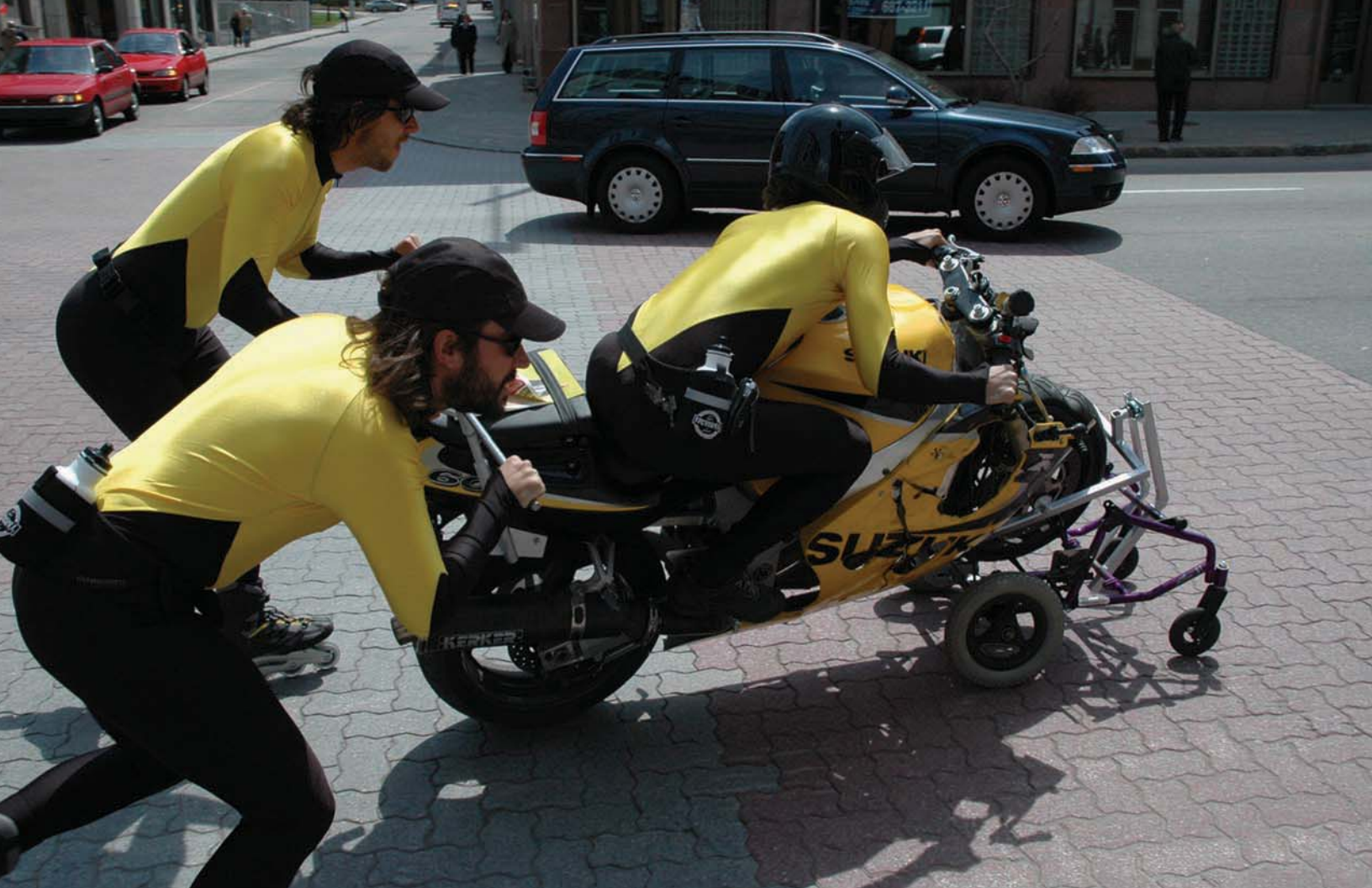
(haut | top) BGL, Postérité-les-bains (Usine de sapins) , 2009. ; (centre droit | right) BGL, Chapelle mobile , 1998.