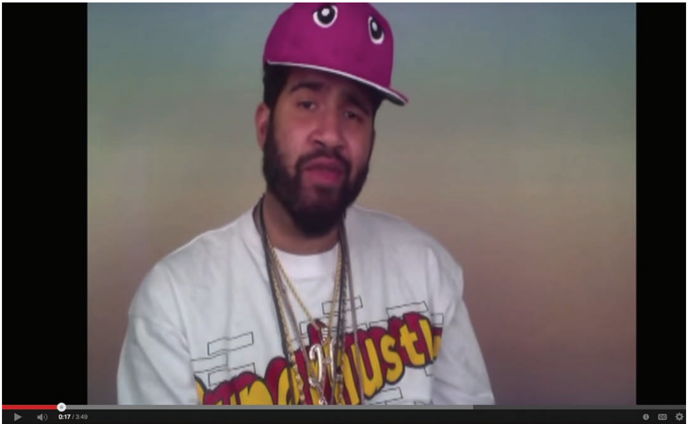
HENNESSY YOUNGMAN, ART THOUGHTZ: THE STUDIO VISIT & ART THOUGHTZ: GRAD SCHOOL , CAPTURES VIDÉOS | VIDEO STILLS, 2012. PHOTOS : PERMISSION DE L'ARTISTE | COURTESY OF THE ARTIST