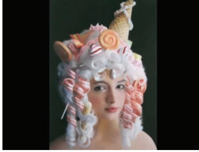
HENNESSY YOUNGMAN, ART THOUGHTZ: ON BEAUTY, CAPTURE VIDÉO | VIDEO STILL, 2011.

probablement là que réside une bonne partie des problèmes méthodologiques que présente l'analyse de cette situation.