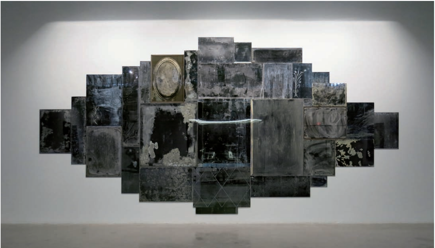
Nicolas Baier, Vanités 04 , 2013.