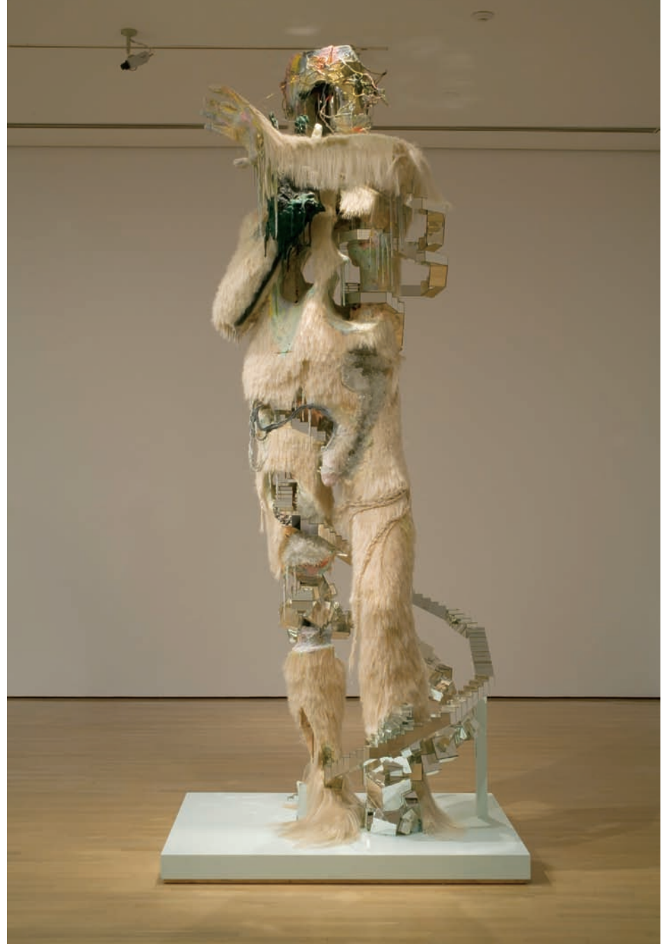
David ALTMEJD, Le Berger , 2008. Bois, contreplaqué, mousse de polyéthylène rigide, mousse de polyuréthane expansée, crin de cheval, cristaux, peinture, fils de fer, fils de laiton, perles de verre. 365,7 x 152,4 x 121,9 cm (approx.). Achat. Collection Musée d'art contemporain de Montréal.

Alors Déjà ? Comment interpréter ce «Grand déploiement de la collection»? Intéressant point de vue ou constat global? Casting discutable et thèmes nébuleux? Compte rendu promotionnel et rétrospectif de vingt-cinq années d'activités au MACM? Le plus étonnant au final est que l'addition tient même d'une certaine forme de miracle. Et ce, si l'on tient compte que deux systèmes sociolo-