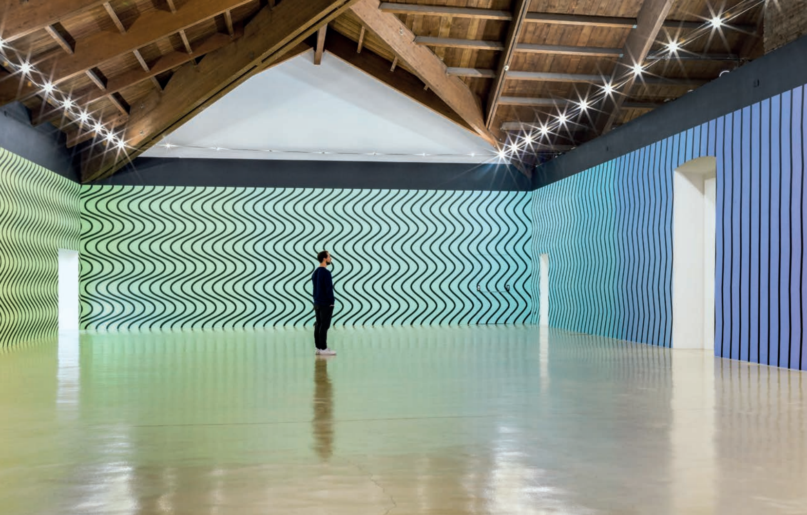
Claudia Comte , How to Grow and Still Stay the Same Shape , 2019. Castello di Rivoli, Turin (Italie).

révèle l'ancienneté. Ici, le glacier n'est déjà plus présenté dans son intégrité puisque l'iceberg est un fragment de glacier (ou du front de mer d'un glacier continental étendu de type inlandsis, ou encore d'une barrière de glace) qui s'est détaché et qui flotte dans la mer. Comme si la surface déjà érodée de l'iceberg ne témoignait pas assez du processus de fonte en cours, l'artiste s'attaque à la glace dans une opposition thermique orchestrée de façon frontale. Son intervention relève presque de l'expérience scientifique : par la simulation d'une fonte accélérée, quelle sera la vitesse de désintégration de ce reste de glacier ? En fait, cette confrontation thermique extrême est une façon de provoquer le spectateur. Ici, l'artiste devance les modélisations de la réponse des glaciers au réchauffement planétaire et s'attache à montrer directement vers quoi l'augmentation continue des émissions de gaz à effet de serre aboutira. Charrière montre sans ambages les conséquences de l'action humaine.