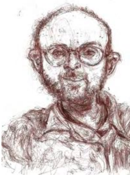
Bryan Lewis Saunders, Volium 20mg , 3 août 2001. Stylo à bille sur papier, 20 x 28 cm.

En un sens, l'intérêt et la limite de l'œuvre de Saunders sont de se présenter comme l'exacerbation du concept de Do-It-Yourself, terme qui va jusqu'à prendre chez lui les acceptions de « -to yourself, -about yourself, -for yourself ». L'artiste, d'ailleurs, ne s'en cache pas, affirmant que l'essentiel n'est pas pour lui la production d'autoportraits, mais le processus transformatif qui en est à l'origine : « [...] it is about the process or all of [the portraits] together as a tool for the transformation of my self. That is the real work of art. My self » (Artfully 2017). Cette entreprise autotélique, qui fait l'économie de prises de position critiques et produit des bricolages non commercialisables, le place en autarcie vis-à-vis des circuits officiels de l'art contemporain 7 . Mais il apparaît, en définitive, significatif que la présentation la plus exhaustive de l'expérience éminemment individuelle – pour ne pas dire incommunicable – des drogues survienne au sein d'une telle démarche.