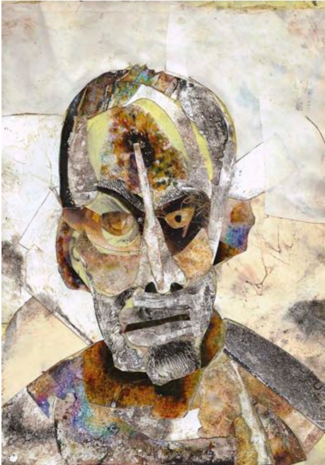
Bryan Lewis Saunders, Morphine IV , 20 mars 1997. Collage sur papier, 20 x 28 cm.