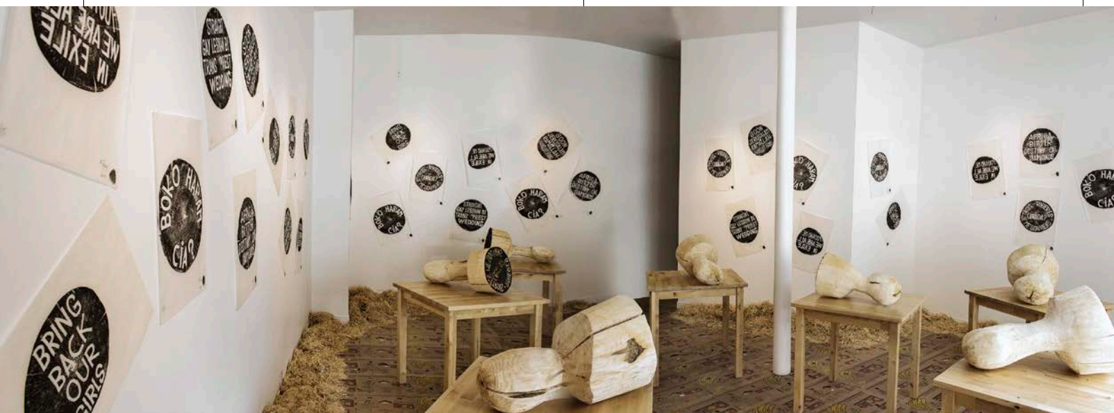
Haut : Krijn de Koning, Losing one footage , 2014. Bas : Barthélémy Tognon, Le Bat des fraises , 2014.

Les propositions de Guillaume La Brie se font autour de l'expérience spatiale et visent très souvent à transformer notre perception de l'espace et du corps. Dispersées dans plusieurs pièces, des sculptures semblables à des statues en négatif ou même à des socles où un rien, un vide repose, semblent invitantes. Lors du vernissage 7 , des performeurs activaient les sculptures en se moulant aux formes, à leurs profils noirs. Comme un jeu des correspondances de formes géométriques, le spectateur-regardeur est lui aussi tenté d'épouser les formes manquantes en se recroquevillant et en se contorsionnant afin de se nicher au creux de ces sculptures.