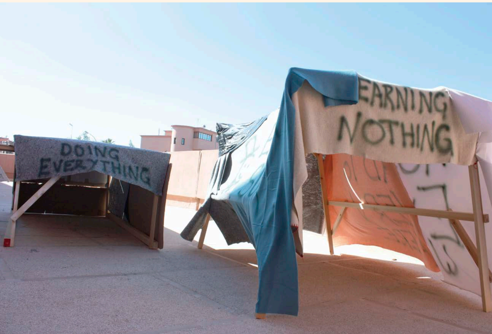
Brandon LaBelle , Hobo College for Itinerant Studies (Confessions of an overworked artist) , 2014. Installation. Dimensions variables/Variable dimensions.

Pages suivantes/Following pages: Marco Montiel-Soto , Memories are Made of Chances and Mistakes - Archeology of a Journey in Morocco , 2014. Installation, objets trouvés/ Installation, found objects. Dimensions variables/variable dimensions.