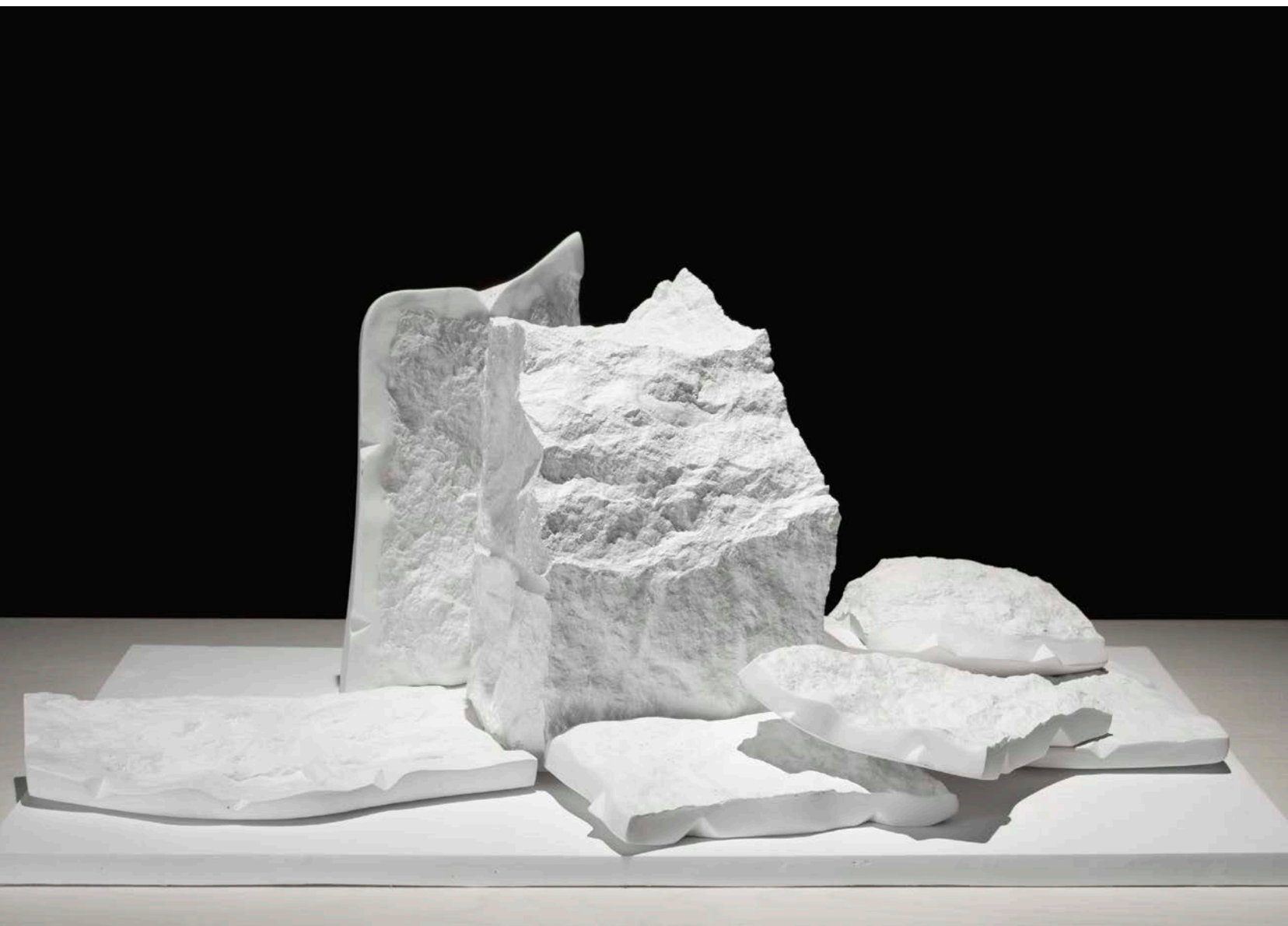
Chloé Desjardins, Apparition , 2013. Merisier russe, plâtre, teinture et vernis, 38 x 48 x 75 cm (pièce), 75 x 80 x 105 cm (base).

Thus displayed, these pedestals seem to have been denied their power of elevation and to have been diverted from their function of presenting a statue. This is similar for a work called Origine , which is a heap of plaster powder placed on a pedestal and protected in a display case. This “origin” has no connection to a precise model; rather, it identifies the material that makes it possible to duplicate any object. In short, Desjardins’s L'atelier du sculpteur is less a theatre of representation symbolizing the creative activity of the demiurge artist than a theatre of repetition – a repetition that hides, or disguises, the meaning of what, in a certain vision of art, is considered the origin of the artwork.