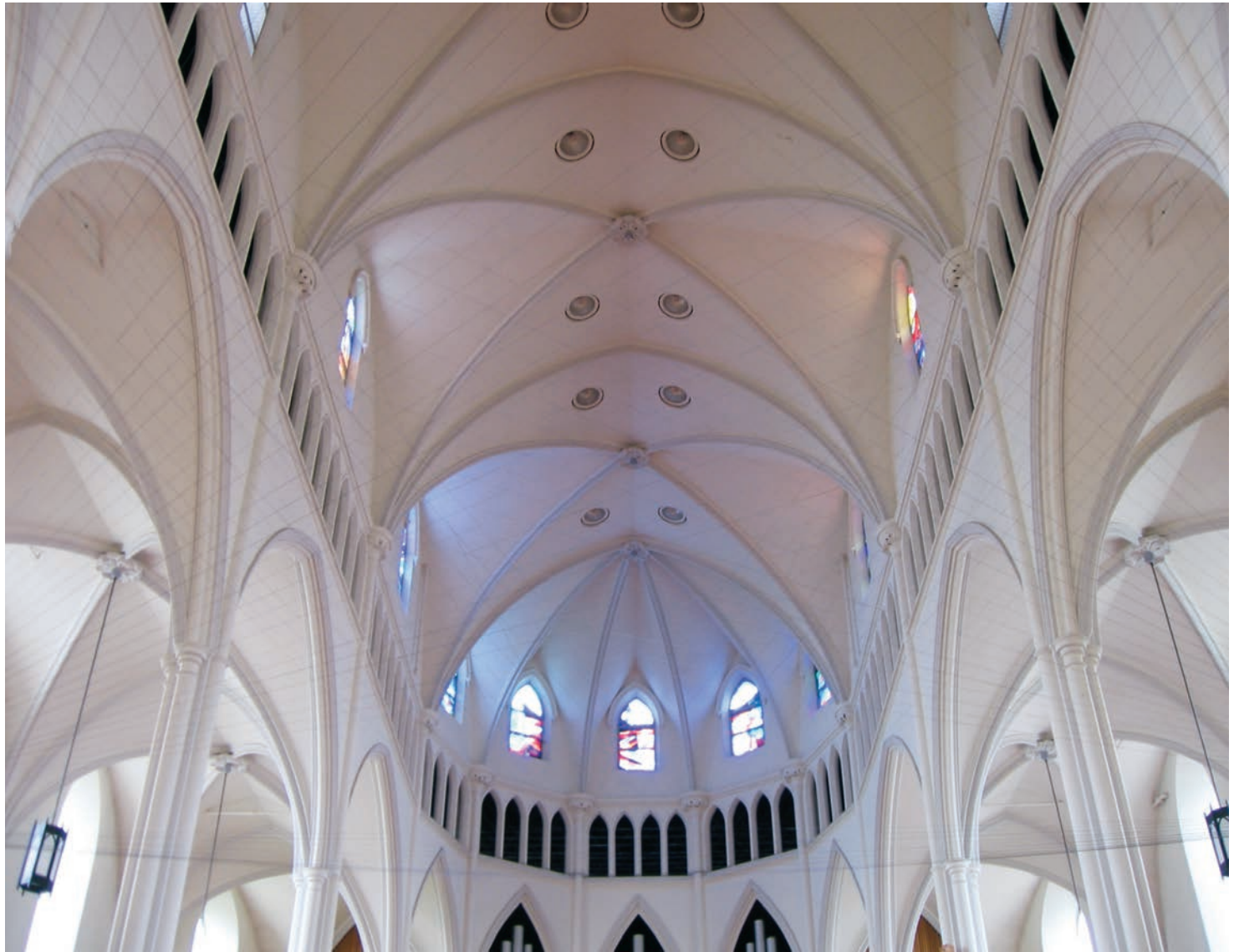
Martin BOISSEAU, Neuvième temps: excédent vide (version deux: Grand blanc haut/ Mince noir long), 2006. Rubans vidéographiques étirés et déployés dans la cathédrale Saint-Germain de Rimouski/ Unwound videotape installed at St. Germain Cathedral in Rimouski.