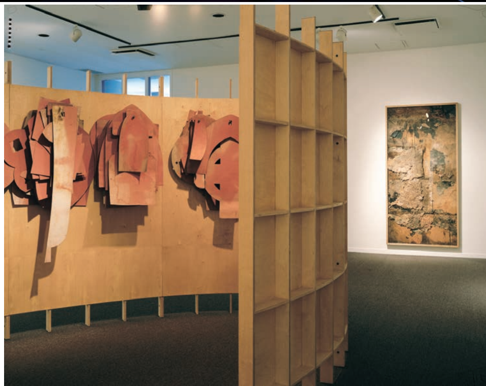
Irene F. WHITTOME , Conversation Adru , 2004. Détail/Detail. Bois, carton, métal, environnement sonore/Sound environment. 640 x 320 x 244 cm. Forman Art Gallery of Bishop's University, Lennoxville, Québec.