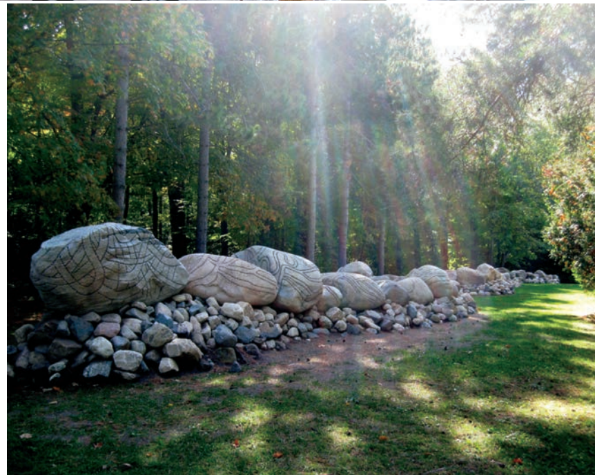
Bill VAZAN, L'eau source de vie, 2011. Granite de/from Rigaud. Gravure au jet de sable: points, lignes et pétroglyphes/Sandblast: lines and petroglyphs. Sanctuaire Notre-Dame-de-Lourdes, Rigaud.