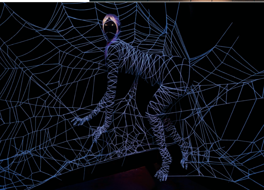
Shary BOYLE , White Light , 2010. Mousse, tissu, ficelle, porcelaine, cheveux, lumière noire/black light. Approx. 305 x 305 x 183 cm.