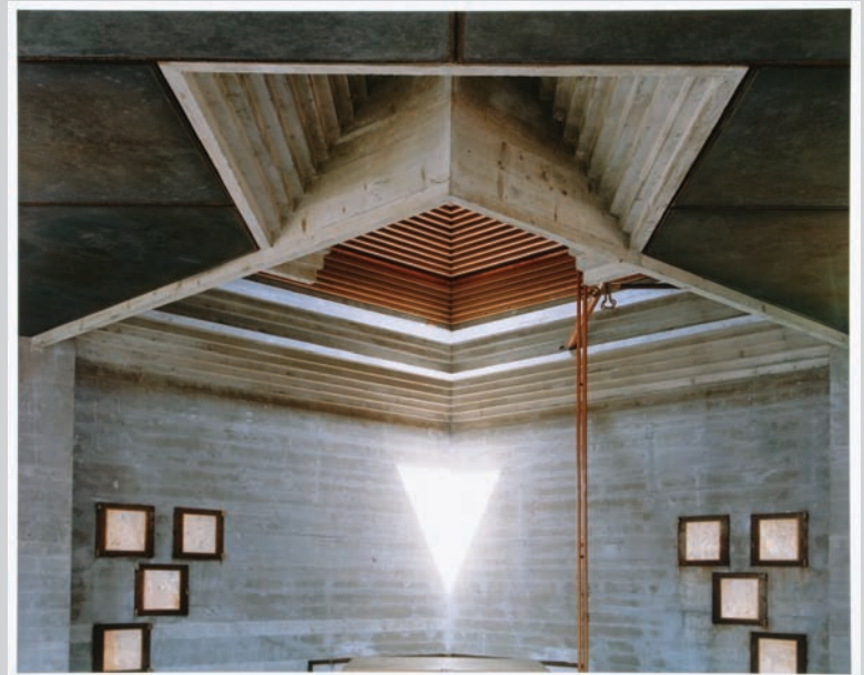
Guido Guidi, Brion's Family Tomba, San Vito d'Altivole: 12PM, Looking to the North , 2006, c-print, 60,8 x 76,4 cm, courtesy of the CCA.

James D. Campbell is a writer on art and independent curator based in Montreal. The author of over 100 books and catalogues on contemporary art and artists, he contributes frequently to visual arts publication across Canada.